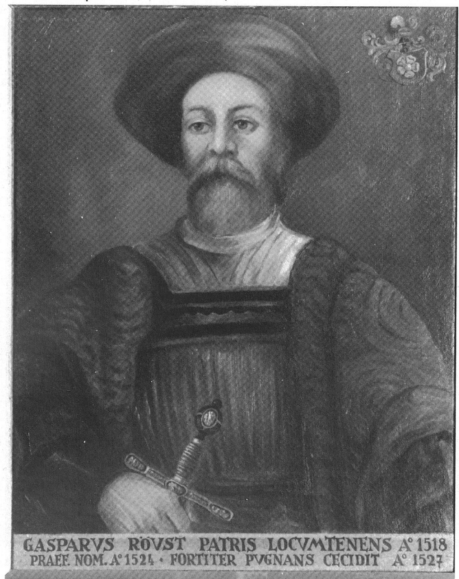
Oberst Kaspar Röist (1518-1527).

GASPARVS RÖVST PATRIS LOCVMTENENS A° 1518 PRAEF. NOM. A° 1524 • FORTITER PVGNANS CECIDIT A° 1527