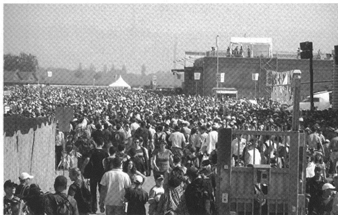
Même dans leur plus beaux rêves, les organisateurs n'osaient imaginer une telle affluence pour Air 04.