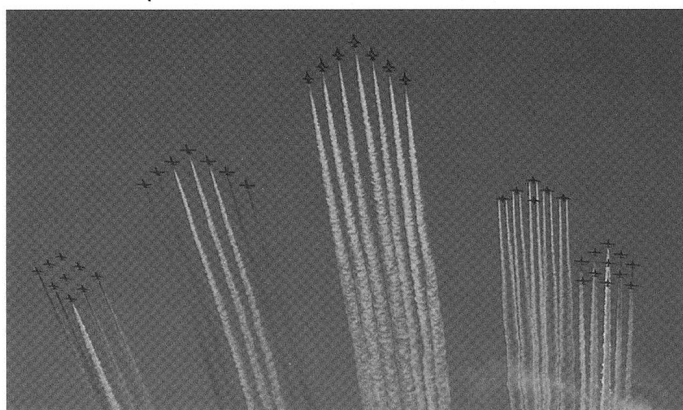
La Patrouille des Patrouilles regroupant les plus prestigieuses formations avaient offert un bouquet final majestueux à Air 04.