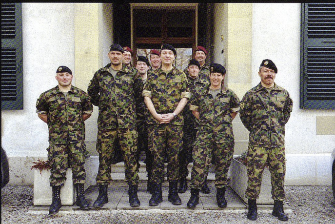
L'état-major du bat chars 17 à la villa Dufour.