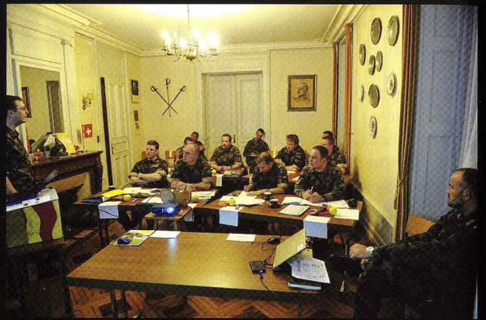
Donnée d'ordres aux commandants de compagnie, à la suite des journées de travail d'état-major.