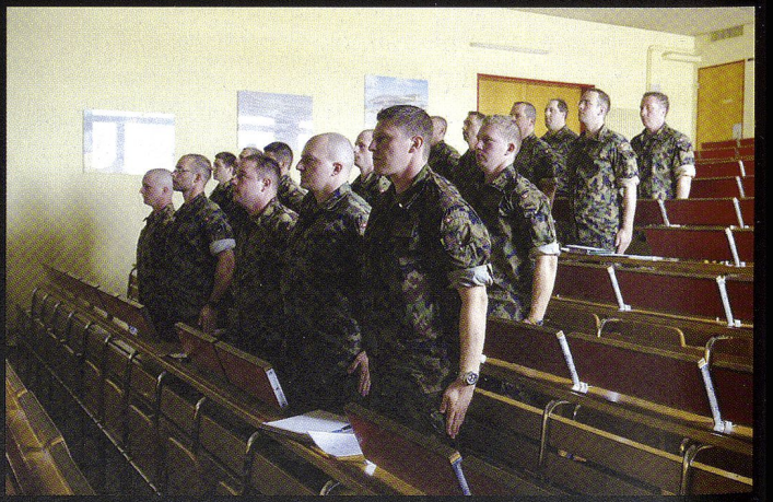
Entrée en service des commandants de compagnie, cours de cadres, 3.09.2012 à Bure. ZEPHYR commence...