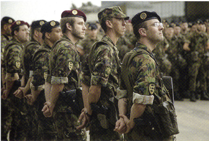
Le bataillon de chars 17 à l'annonce « Pronto SUBVENIO » et prêt pour le mot de l'aumônier, sous un ciel d'orage, le 11.09.2012.

Restons donc ouverts d'esprit. Interrogeons-nous sur notre travail, sur notre action. Ne prenons rien pour acquis. Ne recherchons pas les erreurs et les faiblesses, le