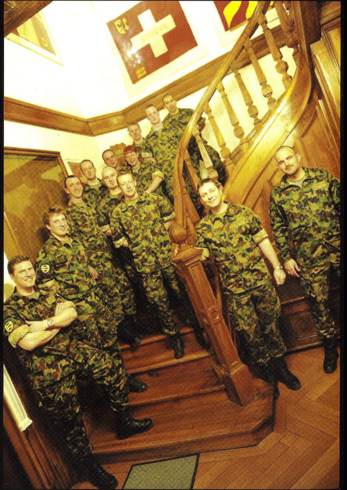
L'état-major réduit et les commandants de compagnie à la villa Dufour, pour la donnée d'ordres, 9.03.2012.