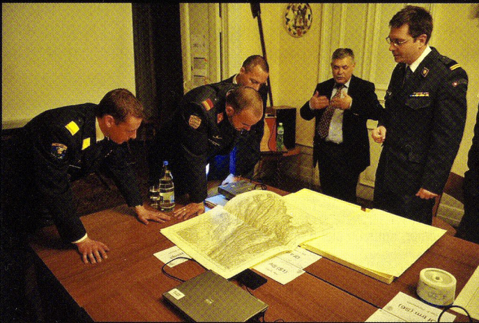
Exposé sur la vie et l'oeuvre du général Guillaume-Henri Dufour.