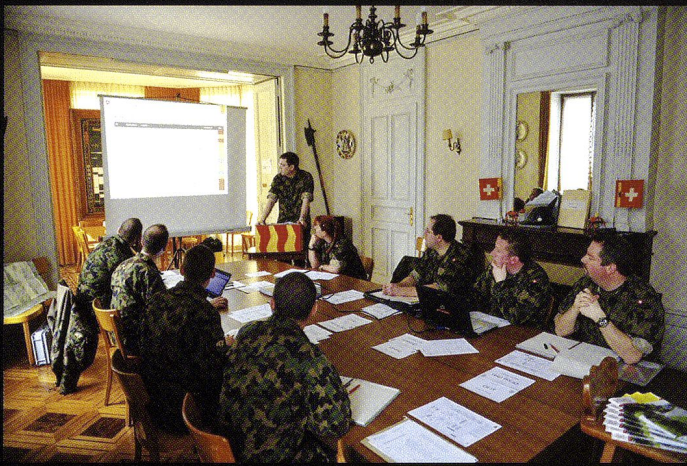
Les journées de travail d'état-major (8-9.03.2012) ont eu lieu à la Villa Dufour, à Genève. Elles servent à la préparation du dossier d'ordres pour le cours de répétition.