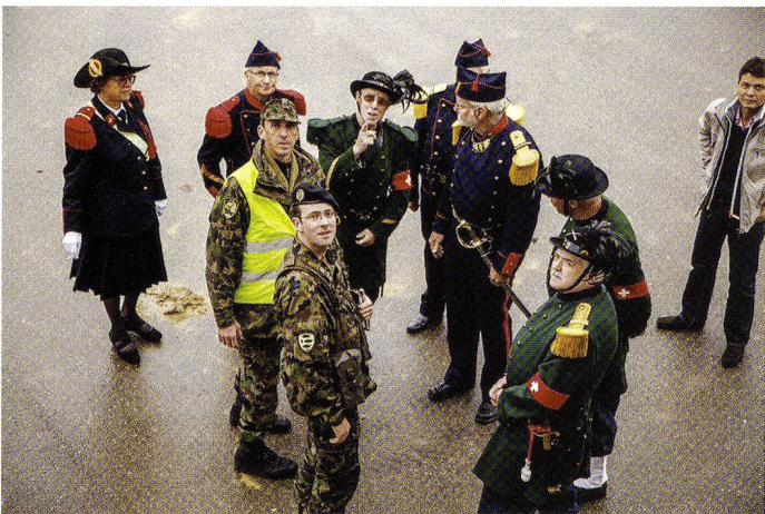
Mise en place des carabiniers et des artilleurs genevois, pour la cérémonie de remise de l'étendard le 25.09.