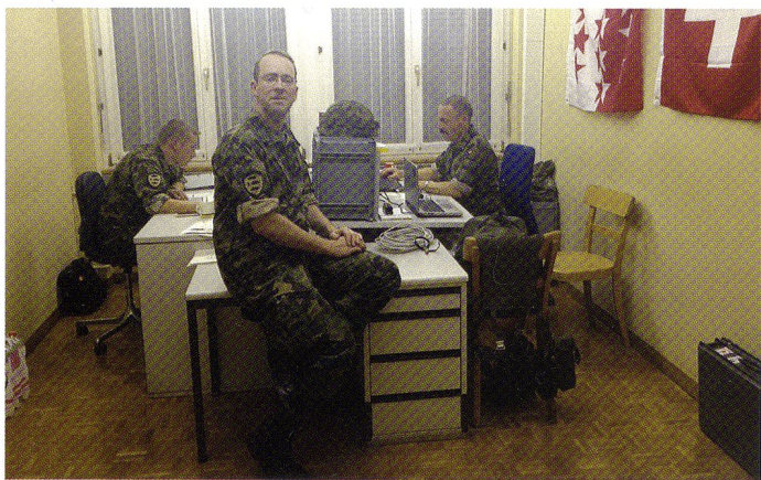
De gauche à droite : S3, S1 et of disp. Mieux ne vaut pas compter ses heures...

et demandes de remplacement ou de renforts auprès du Personnel de l'armée (J1) ou du commandement de brigade pour garantir les effectifs; suivi des mutations et des dispenses accordées par les organes cantonaux en charge de l'administration militaire pour pouvoir réagir à temps, lorsque cela est encore possible; traitement des dossiers des candidats pour qu'ils puissent accomplir les écoles et cours techniques; recherche active de nouveaux candidats, dès avant le cours, pour assurer l'occupation de toutes les fonctions ou combler les manques les plus graves. L'appui du personnel professionnel (J1, commandements des formations d'application, des centres de compétence ou des grandes unités) est précieux pour permettre, selon les termes du brigadier