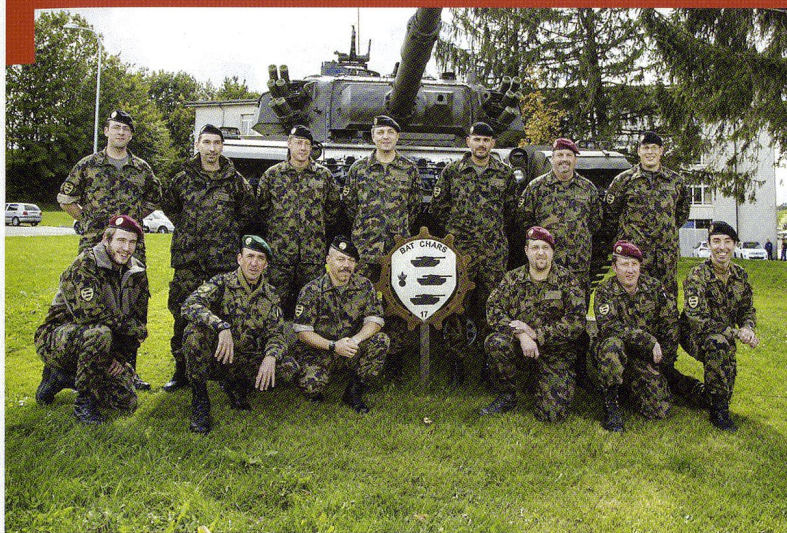
EM bat chars 17