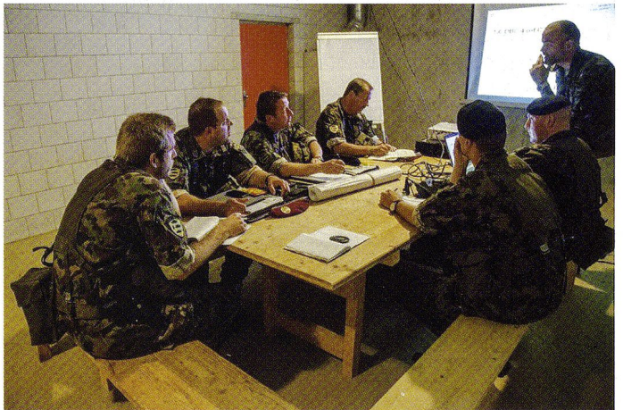
Rapport d'état-major, conduit par le cdt rempl, dans un PC mobile à Cornol.

la mécanique de ses différents éléments. En d'autres termes, il s'agissait d'huiler une dernière fois les rouages de la compagnie.