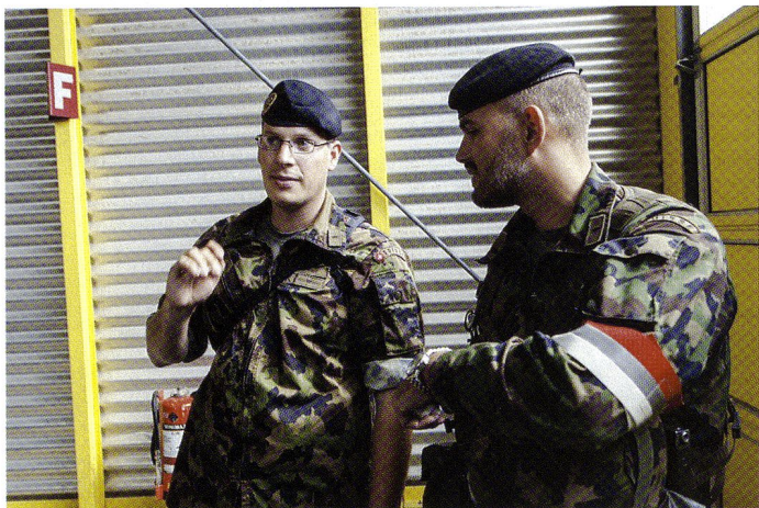
Le S6 et le cdt rempli dirigent l'exercice ZULU.