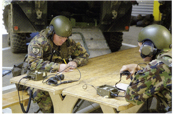
Permanence radio à l'EAVC.