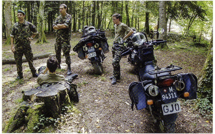
Les sct PC mob et éch cond disposent chacune de 6 motocs pour leurs reconnaissances.

Le lundi était consacré aux préparatifs et à l'entraînement en formation. Cette journée a permis au commandant de compagnie de régler et d'ajuster la technique et