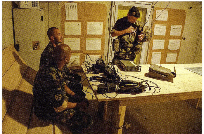
La centrale télématique est exploitée en permanence.