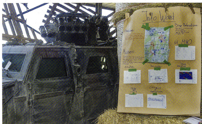
Installer une « base d'exploration » permet l'engagement dans la durée. Ici, le tableau d'affichage.