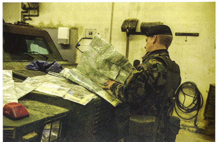
Le chef de section prépare son engagement.

Après avoir pris une base d'exploration avancée, les explorateurs commencèrent l'infiltration tout d'abord à bord des Eagle dans la zone d'infiltration 1 (libre d'adversaire) en se déplaçant rapidement. Lorsque la