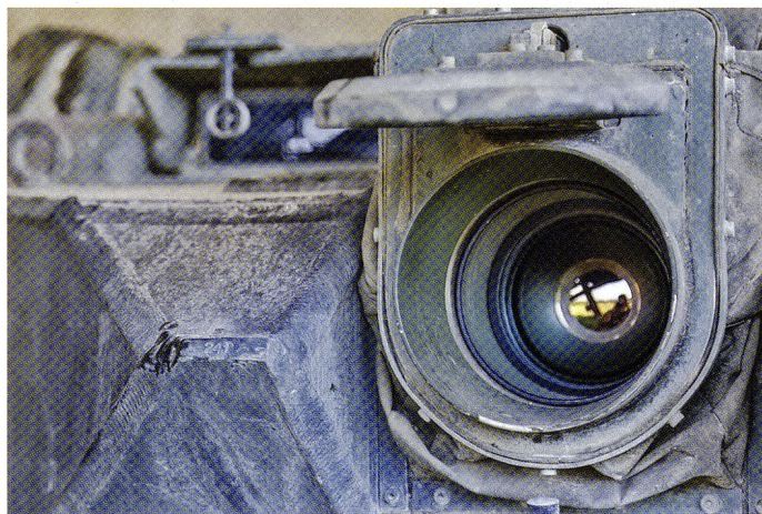
Les véhicules d'exploration sont dotés d'intensificateurs de lumière résiduelle (ILR) et de caméras thermiques (WBG, photo).