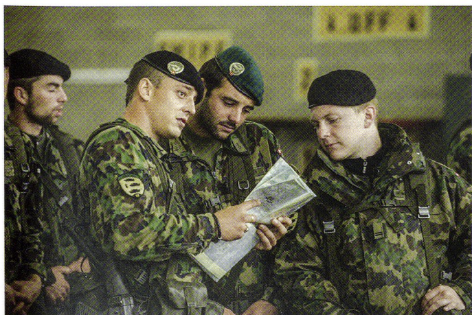
Coordination en vue de l'exercice de bataillon FONDO.