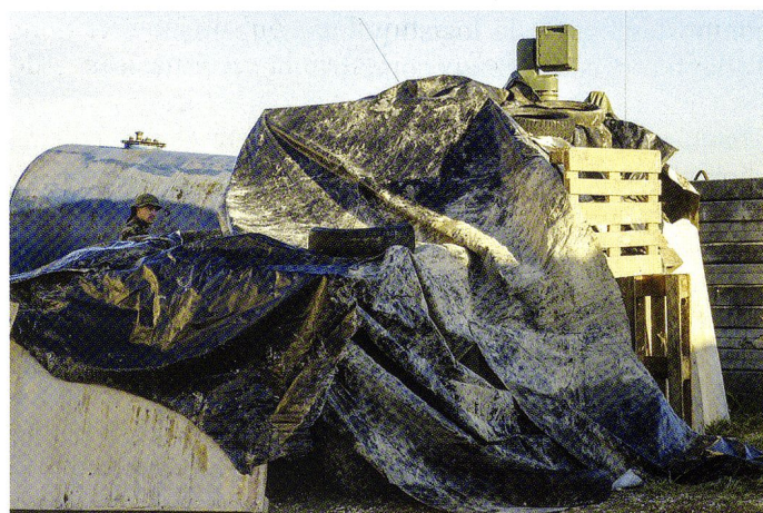
Un véhicule commandant de tir « camouflé. »