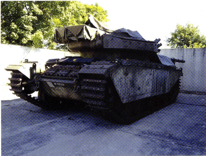
Le Centurion amené à Aïre-la-Ville, où a pu avoir lieu la restauration.