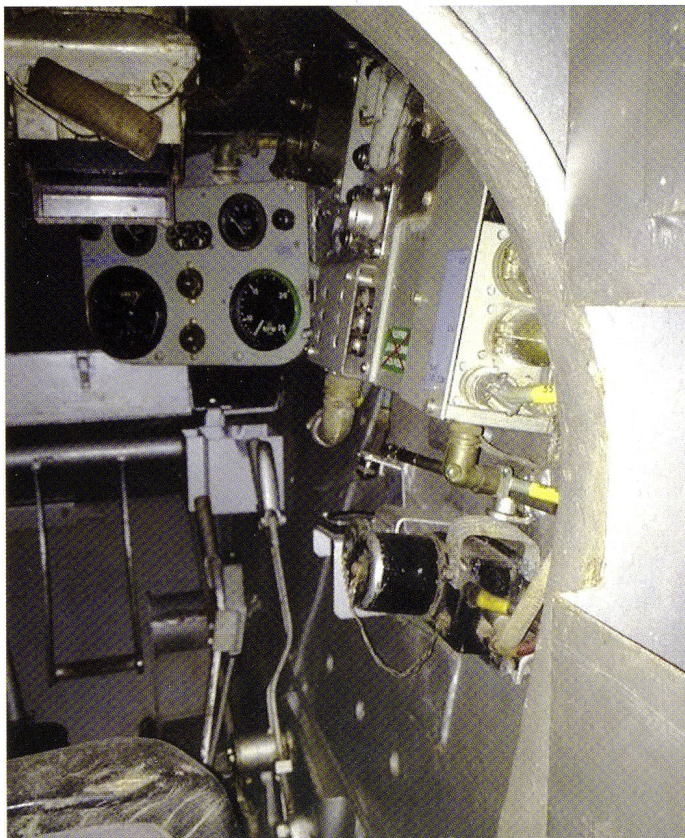
L'intérieur du char 55, revalorisé en 1960, bien conservé pour son âge...

Nous avons ensuite poncé entièrement le char. Le temps nécessaire est considérable, car le char a une grande surface avec beaucoup de détails. Par la suite, nous avons protégé les parties qui n'étaient pas à peindre.