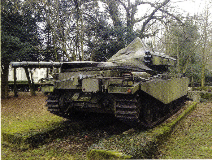
Le char 55 « en l'état » chez son ancien propriétaire, à Bellevue (GE). Il avait été acquis par un privé en 1982.