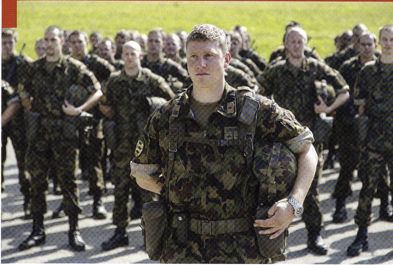
Cp chars 17/2