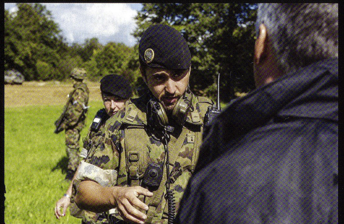
Z-LEAD : Les participants peuvent suivre en direct le déroulement de deux exercices de section au Rondat, commentés par le commandant de compagnie.