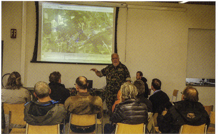
Le cdt C Dominique Andrey, commandant des Forces Terrestres, devant l'exécutif du canton de Glaris in corpore , le 25.09.