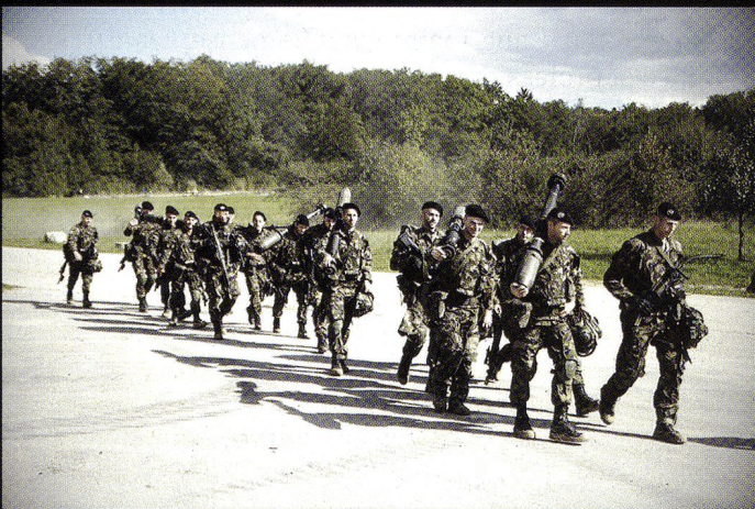
La section Bucher, de retour de l'exercice au Rondat Sud.