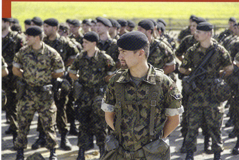
Cp gren chars 17/4