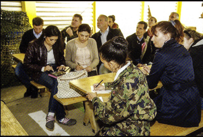
Z-LEAD, le 19.09. Une vingtaine de participants de l'Association suisse des cadres (ASC) et d'autres institutions reçoivent une introduction à un exercice tactique.