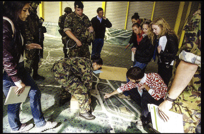
Z-LEAD : Prise de décision sur carte par deux équipes de participants.