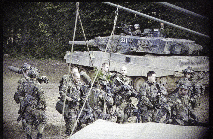
La section Delarive, au Rondat Nord.