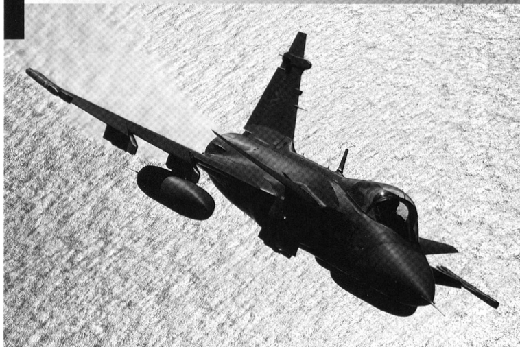
Un JAS-39 C Gripen hongrois en patrouille. Cet appareil peut recevoir jusqu'à trois réservoirs de carburant auxiliaires, afin d'augmenter son autonomie.