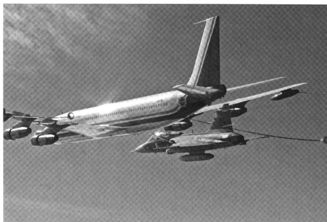
Ravitaillement en vol d'une formation de Gripen , par un Boeing 707 | KC-135.

Encore un mot au sujet de la Suisse en tant qu'espace de paix. Si la gauche est réellement pour la paix, elle doit reconnaître l'espace de paix helvétique. En nous engageant pour empêcher toute guerre dans notre pays, nous-mêmes et d'autres pouvons agir à partir d'ici pour un monde plus raisonnable dans le sens de nos traditions humanitaires. Si, par exemple, Genève reste un lieu sûr