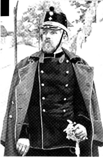
Un officier judiciaire suisse, illustration de Charles Eggimann in l'Armée suisse (1874) de O. Etoppey.