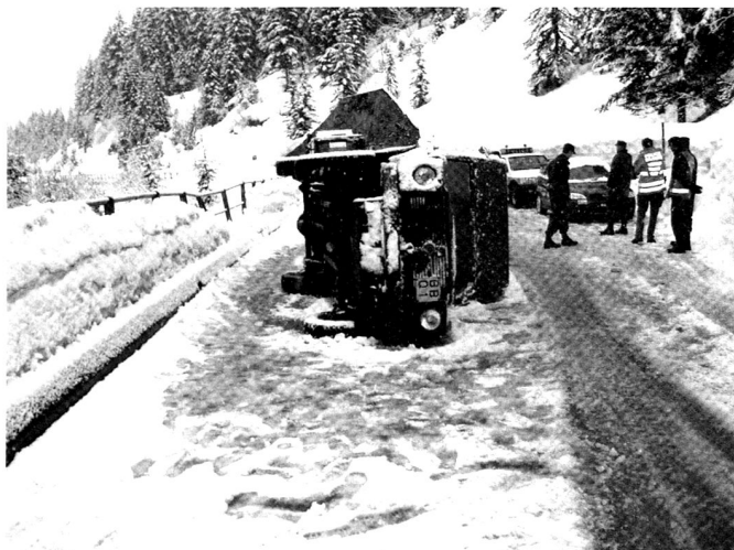
Accident de la circulation survenu le 28 mars 2006 sur la place d'armes de l'Hongrin (Vaud), sans blessé. Le Juge d'instruction a adressé son rapport au edf en proposant un règlement disciplinaire.

Pour illustrer les tâches et les compétences du juge d'instruction militaire, prenons deux exemples inspirés de la pratique judiciaire actuelle, en Suisse et à l'étranger : celui d'un vol de munitions et d'intensificateurs de lumières résiduelles (ILR) durant un service d'instruction en formation (SIF) et celui d'une divulgation de secrets militaires à des tiers. Lorsque le suspect est un militaire en service au sein de la troupe au moment de la découverte des infractions, le commandant d'école si le militaire est en formation, ou le commandant de bataillon si l'infraction a lieu lors d'un SIF, peut interroger le militaire concerné avant d'ordonner une enquête pénale. Ses déclarations peuvent être consignées dans un procès-verbal. Le suspect peut faire l'objet d'une détention provisoire sur l'ordre d'un supérieur pour une durée qui ne peut excéder 24 heures à compter de l'appréhension. Lorsque les actes délictueux ont été commis en-dehors du service, il appartient à l'auditeur en chef d'ordonner l'ouverture d'une enquête pénale. L'intervention du juge d'instruction. Dans l'un et l'autre cas de figure, le commandant d'école, de bataillon ou l'auditeur en chef doit faire appel au juge d'instruction militaire en lui adressant à cette fin une ordonnance d'enquête. En fonction des circonstances, les mesures prises peuvent être les suivantes :