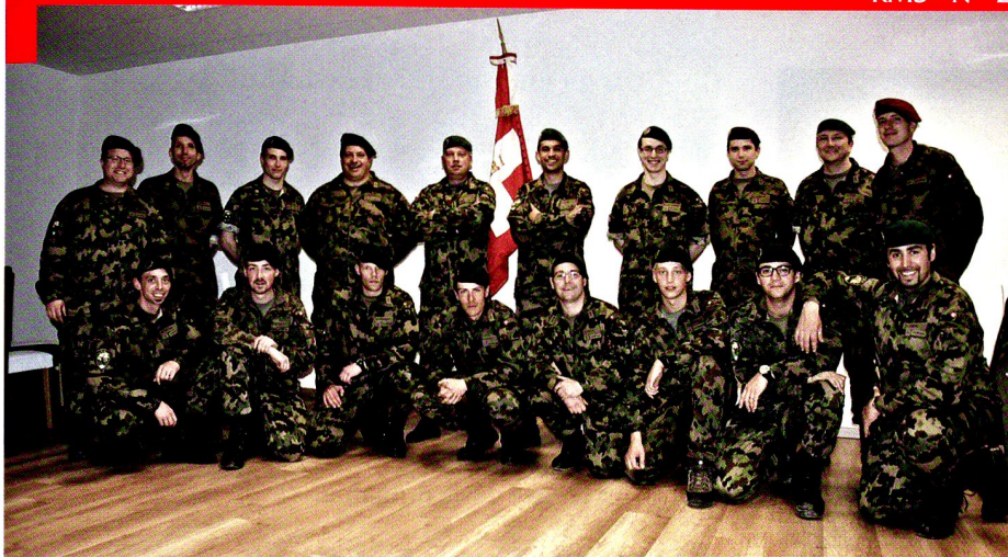
L'état-major et les Centurions du bat car 1.