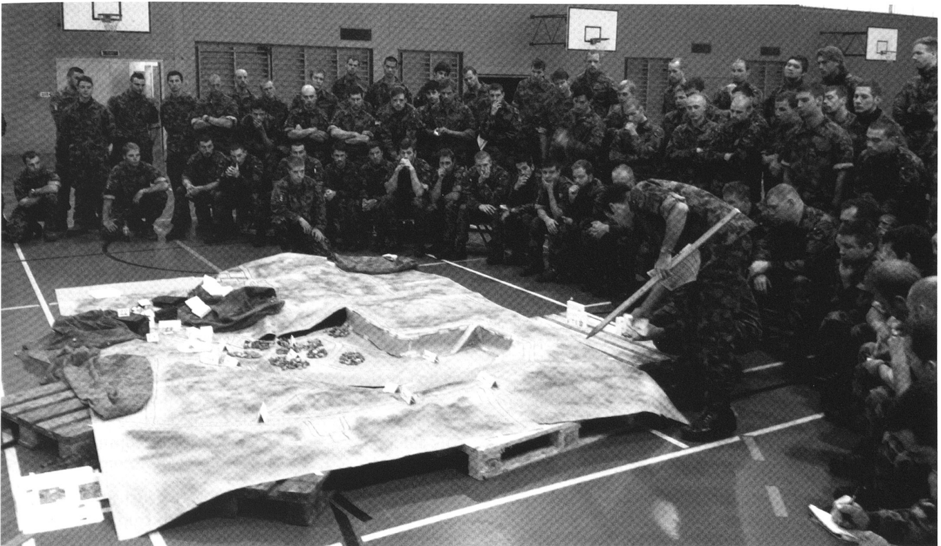
Wargaming d'une unité de grenadiers durant les préparatifs et l'entraînement d'une action lors de l'exercice d'Armée « STABILO DUE ».

professionnelles ou encore leurs activités concrètes font l'objet d'une classification particulièrement stricte et ne font pas l'objet d'une communication publique.