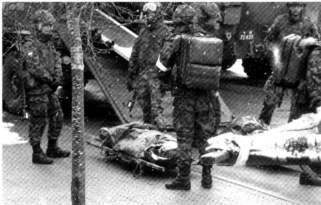
Un nouveau système de formation des troupes sanitaires, ainsi qu'un équipement moderne, sont en cours d'introduction dans les unités.