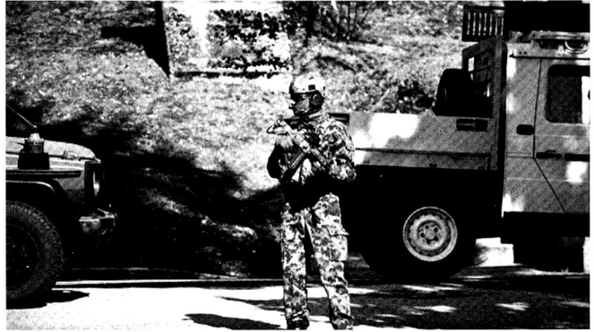
Au cours des dix dernières années, les Forces spéciales ont gagné en importance.

Quant à la qualité de la disponibilité, elle passe essentiellement par des mesures d'organisation, par la fiabilité de la logistique, par la rigueur dans l'instruction et l'entraînement périodique. Un élément déterminant