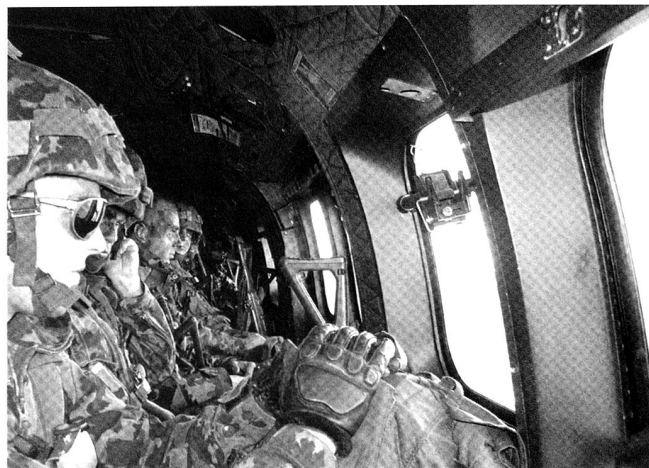
Transport d'une demi-section en hélicoptère Super Puma.