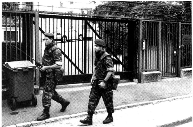
Durant plusieurs années, l'engagement AMBA CENTRO a signifié l'engagement de plus de 300 militaires en permanence, afin de protéger les missions permanentes et les ambassades à Genève, Berne et Zurich.