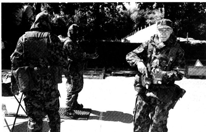
Un bataillon de défense nucléaire, biologique et chimique peut également intervenir en renfort des moyens permanents du Centre (NBC) de compétence de Spiez.

pour qu'il puisse remplir ses tâches : c'est le principe de subsidiarité. Si la Confédération a des responsabilités et des moyens vis-à-vis de l'extérieur, elle n'a à l'intérieur du pays, dans le domaine plus spécifique de la sécurité, que des compétences de coordination et de facilitation entre les cantons. Ses moyens de politique de sécurité sont plus structurels et organisationnels (politique étrangère, renseignements, défense, protection de l'Etat, politique économique, information et communication) que directement opérationnels; seule l'Armée représente une force physique pouvant entrer dans le dispositif global de sécurité, tant sur le territoire national qu'à l'extérieur de ses frontières. La planification des services annuels des formations de milice s'échelonne tout au long de l'année. De ce fait, l'Armée dispose en permanence d'au moins 1'000 soldats prêts à intervenir au profit des cantons ou pour toute autre opération sécuritaire.