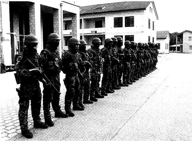
Le combat de maison et en localité a gagné en importance...