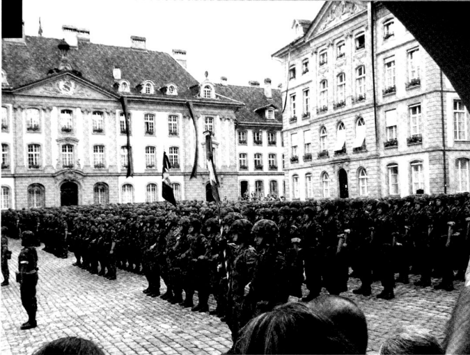
Prise de l'étendard d'un corps de troupe bernois dans son chef-lieu.