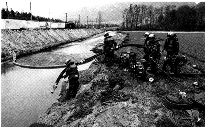
L'armée dispose de moyens très importants pour l'aide en cas de catastrophes naturelles ou techniques.