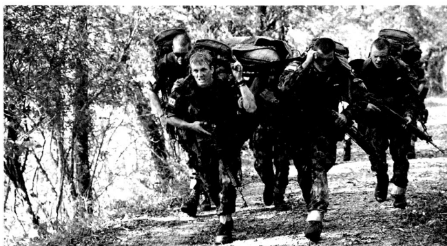
Malgré la brièveté des périodes de service, l'instruction doit être intensive et exigeante.

Dans le cas où l'entraide cantonale ne suffit plus, il appartient à la Confédération d'entrer en jeu avec ses propres moyens. Il ne s'agit pas de mettre un canton sous tutelle mais bien de l'appuyer et de le renforcer