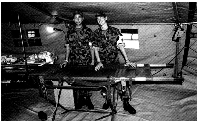
En cas de besoin, des formations militaires en service long ou des corps de troupes peuvent renforcer les dispositifs sanitaires civils.