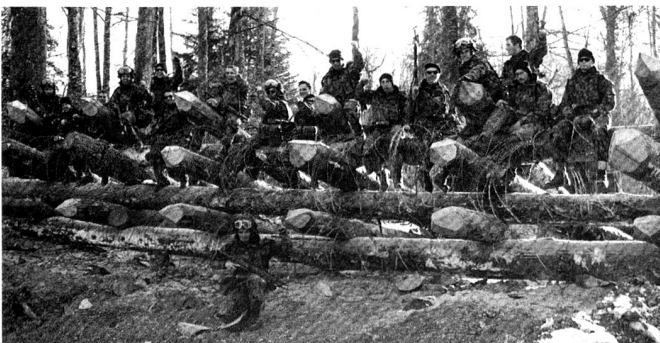
Une section de sapeurs de chars a réalisé un obstacle improvisé, au CIC de Bure dans le Jura.

coiffe le tout, c'est l'encadrement. La majorité des unités de milice sont conduites par des cadres de milice, officiers qui, en parallèle de leurs activités professionnelles civiles, assurent le suivi administratif de leurs troupes et la préparation des déploiements éventuels.