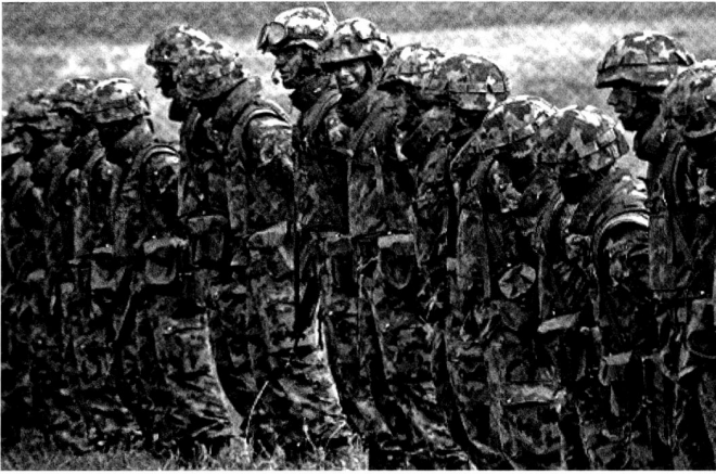
Préparation d'un exercice de section.