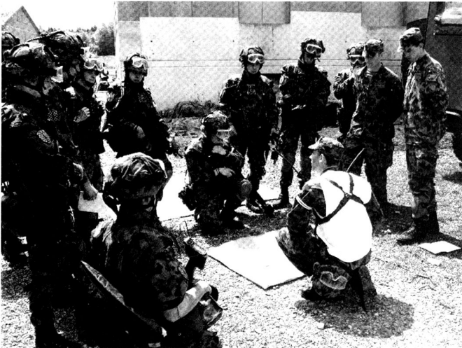
L'instruction et l'entraînement a principalement lieu dans les Centres d'instruction au combat (CIC) de Bure et de Walenstadt