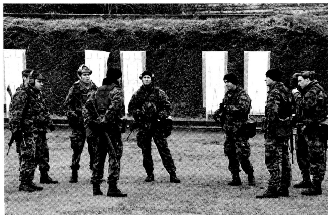
L'instruction au tir est réaliste et rigoureuse.