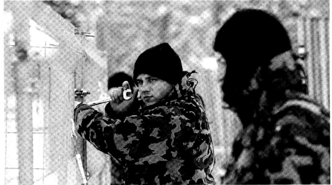
De nombreuses formations ont été engagées pour la protection de conférences (ici le World Economic Forum à Davos) ou d'infrastructures critiques.