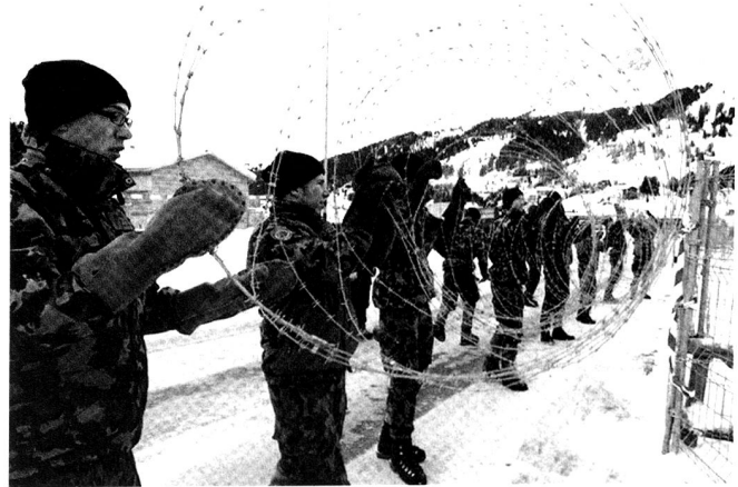
De tels engagements « subsidiaires » de sûreté sont effectués au profit des autorités civiles – en premier lieu les cantons.