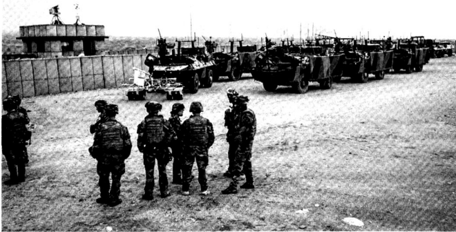
Les moyens peuvent se mesurer en fonction de leur quantité ou de leur qualité. De haut en bas: chasseurs-bombardiers Rafale , avion de surveillance électronique Atlantique , une section d'infanterie montée sur VAB, enfin exercice de débarquement à l'aide de moyens techniques du Génie.