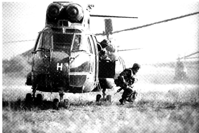
La manoeuvre est passée, en un siècle, du cheval au véhicule à moteur, au char blindé, à l'hélicoptère en passant par l'avion de transport.