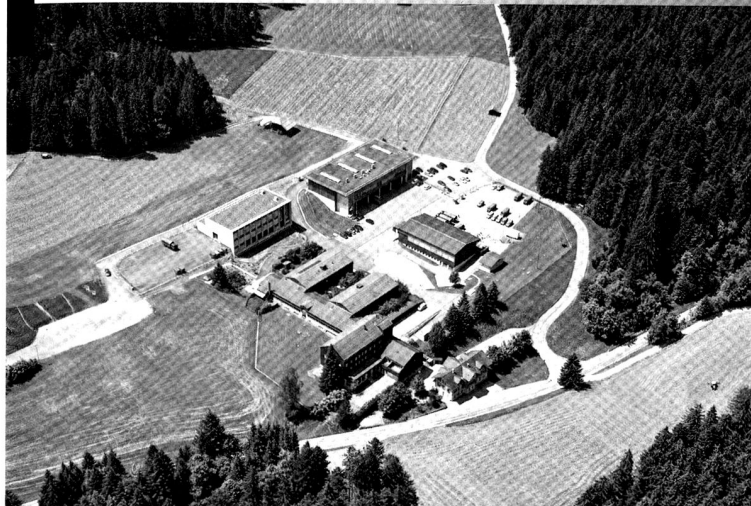
La caserne de Jassbach