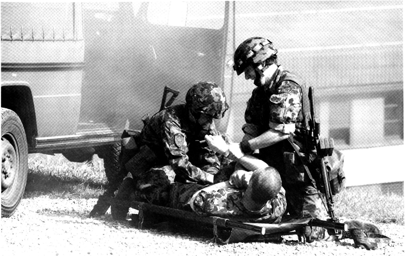
Recrues en pleine instruction militaire de base.