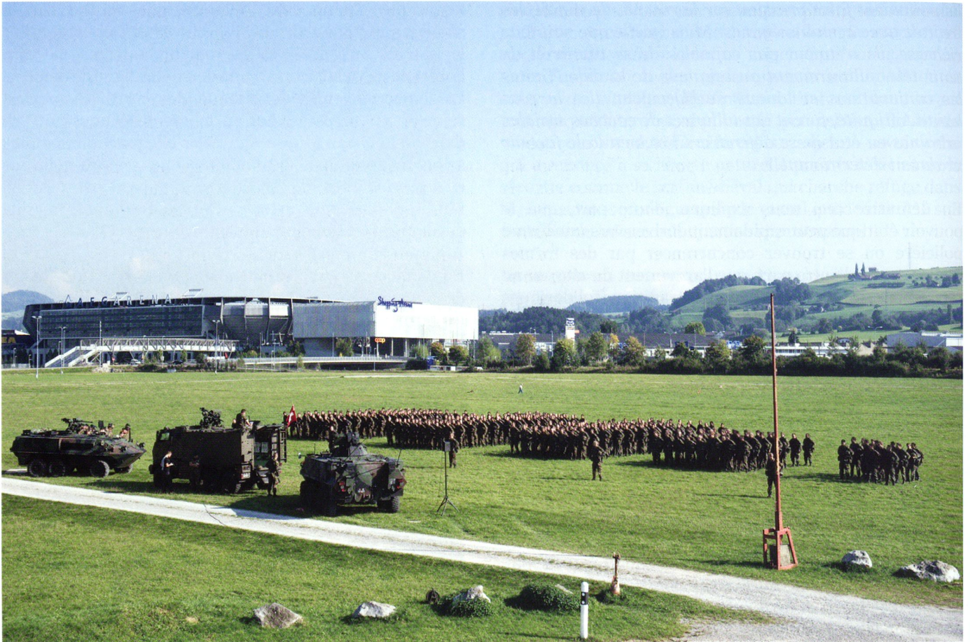
Un bataillon d'infanterie lors de sa prise de drapeau.

monarchie de type oriental : le souverain investi par la divinité et participant par là même en quelque façon à celle-ci..., mais exerçant son pouvoir, théoriquement absolument, par la médiation d'un appareil d'Etat, d'une bureaucratie (et d'une armée) aux rouages extrêmement complexes, d'où, pratiquement, une tyrannie fiscale et policière qui donne à ce nouveau régime un caractère totalitaire en un sens, peut-on hélas dire, déjà moderne du mot. » En réaction, la population cherche de plus en plus à « fuir l'Etat » pour échapper à cette oppression fiscale et policière.