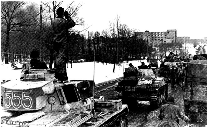
Hiver 1943 : les trois nouvelles divisions de Panzergrenadiere de la Waffen-SS sont concentrées en un corps d'armée ayant pour but de reprendre la ville de Kharkov. On remarque, encore, la présence de blindés légers.

Or l'hiver 1941-1942 rend cette doctrine caduque : faute de moyens propres, en raison des conditions météorologiques, de l'usure des matériels – les chars conçus dans les années 1930 n'ont jamais été conçus pour rouler autant de kilomètres – et enfin en raison de l'opposition soviétique croissante.