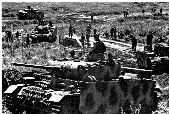
Les PzKpfw III franchissent un pont. Les engins ont quitté la livrée grise pour le jaune sable ; et les « jupes » permettent d'augmenter le degré de protection contre les éclats et les charges creuses tirées par l'infanterie soviétique.

Un PzKpfw IV Ausf. F(1) toujours armé de son 75 mm « court » (L24) négocie une route sur le front de Moscou, au printemps 1942. Faute de peinture et d'équipements hivernaux, l'équipage a camouflé son véhicule avec de la craie.