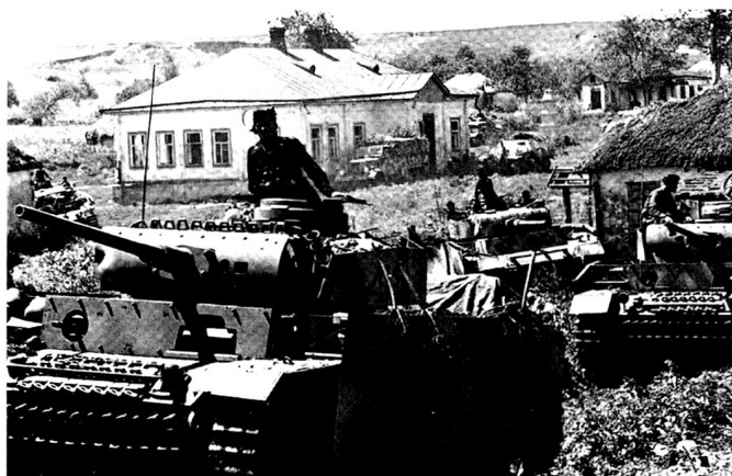
Une compagnie de chars moyens quitte son secteur d'attente afin de gagner sa base d'attaque pour l'opération ZITADELLE : l'offensive sur Kursk. On constate que les formations blindées de 1943 ont perdu leurs chars légers et consistent en un panachage de PzKpfw III et IV – on distingue ce dernier tout à gauche, caché derrière une maison.