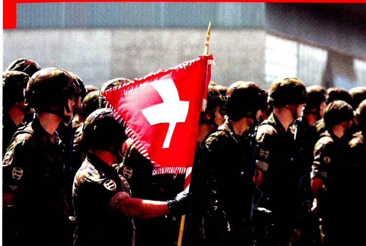
Prise de l'étendard du bataillon de chars 17 à Bure le 15.08.2011.