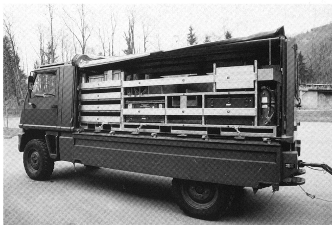
Deux véhicules de type Duro suffisent au transport de la tente de commandement.