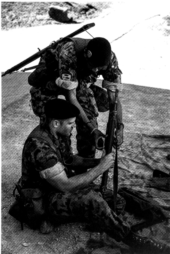
Les possibilités sont nombreuses sur la place de tir de Cholloch.