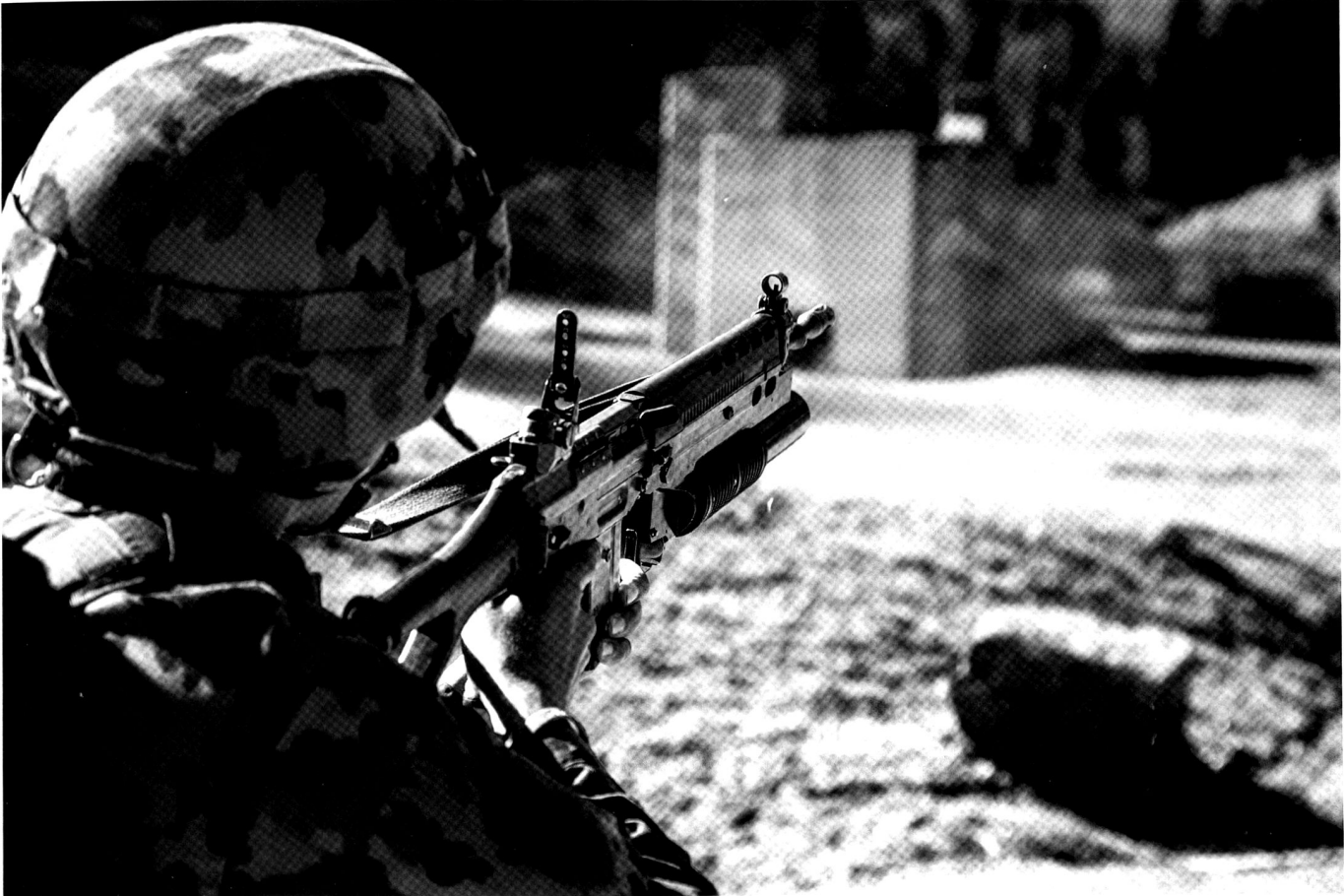
Tir avec le lance grenade additionnel.