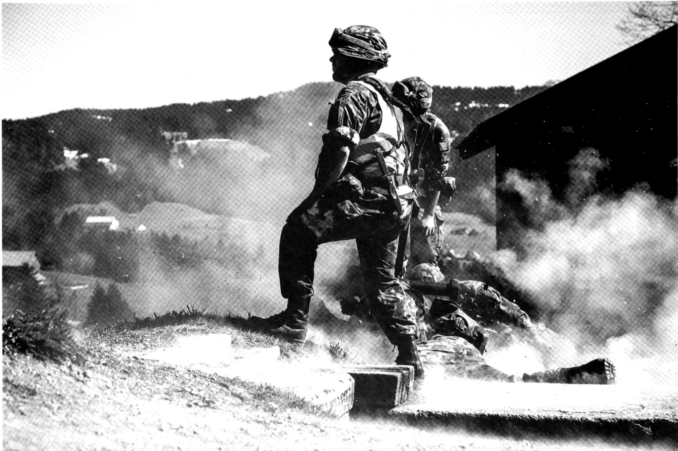
Départ du coup lors du tir avec un Panzerfaust UPat.