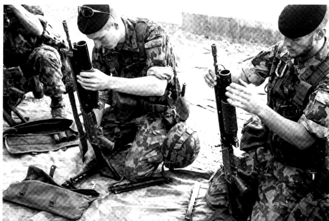
Instruction au montage et démontage du lance grenade additionnel sur le fusil d'assaut 90.