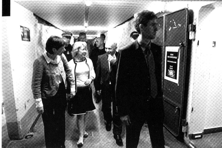
Visite du Chef du DDPS et des chefs des Départements cantonaux de la Sécurité romands, à l'Académie de Police de Savatan.