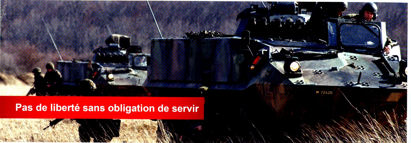
Pas de liberté sans obligation de servir