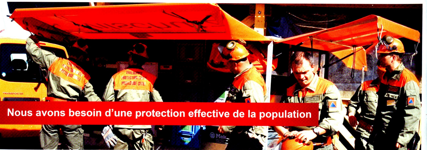
Nous avons besoin d'une protection effective de la population