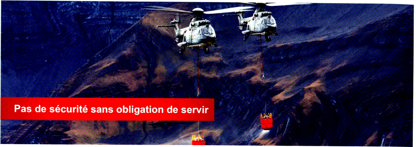
Pas de sécurité sans obligation de servir