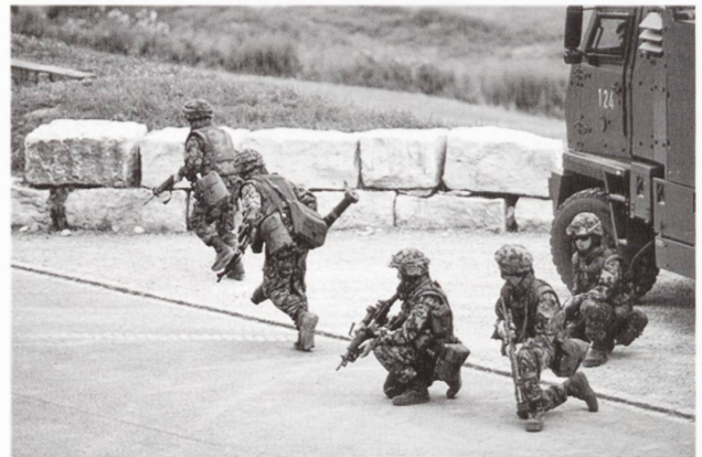
« Combattre - protéger - aider » – La politique de sécurité aujourd'hui doit également inclure la défense et la gestion de risques non militaires, à l'instar des catastrophes naturelles, des effets des crises même à l'extérieur de nos frontières.