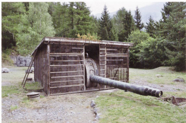
La tourelle T2 de 15 cm au sommet du fort de Dailly.