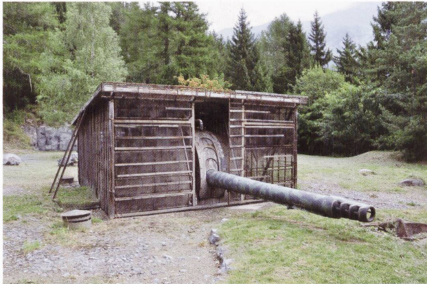
La tourelle T2 de 15 cm au sommet du fort de Dailly.