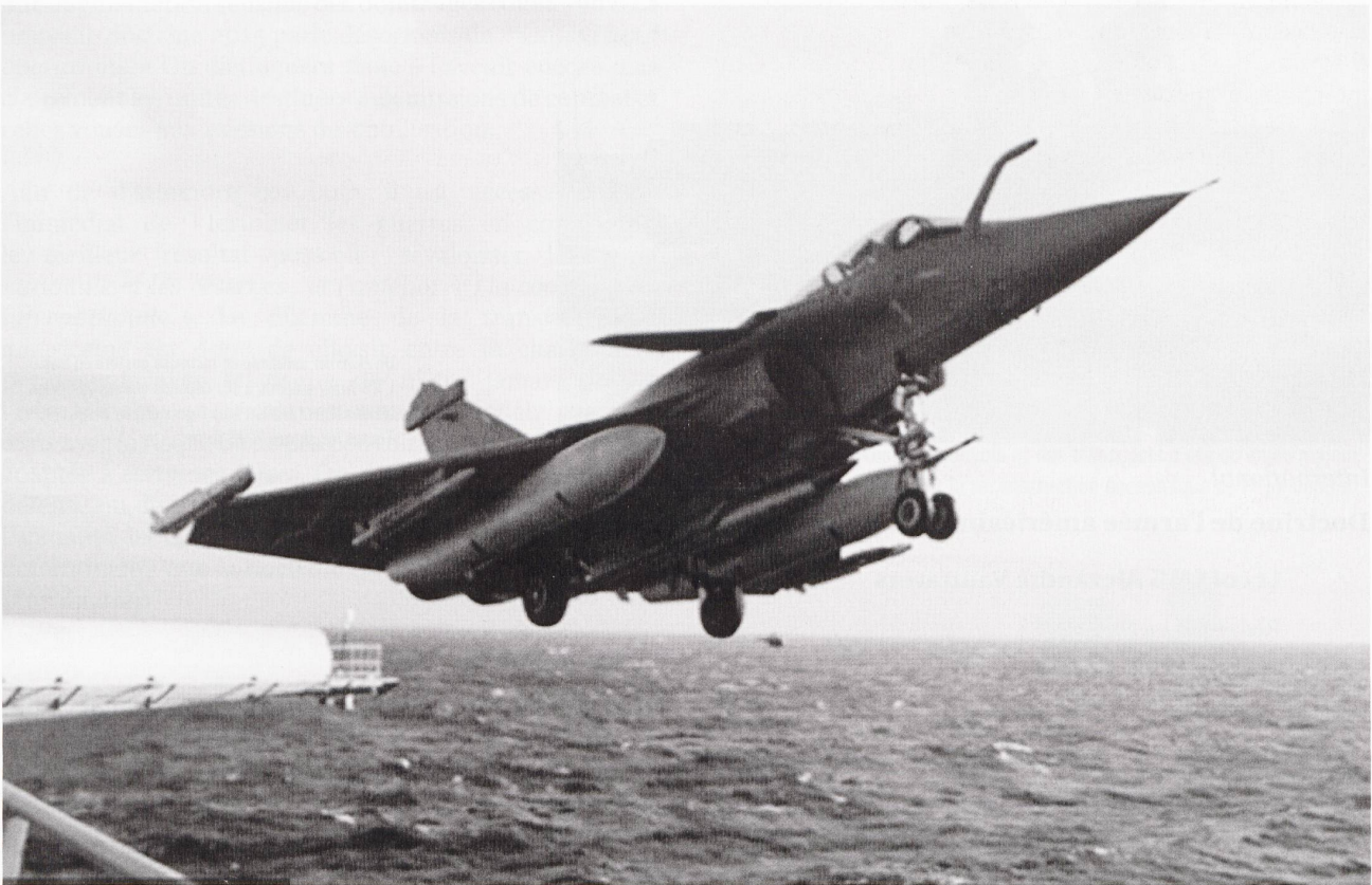
Le Rafale est lui aussi capable d'emporter le missile air-sol moyenne portée (ASMP) à ogive nucléaire. Mais ce missile doit maintenant être modernisé : un programme cher et difficile à rentabiliser.