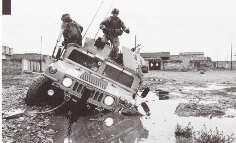
Un Hummer surblindé en fâcheuse posture en Irak. L'US Army a appris à ses dépens que les véhicules blindés légers étaient trop légers et pas assez blindés.