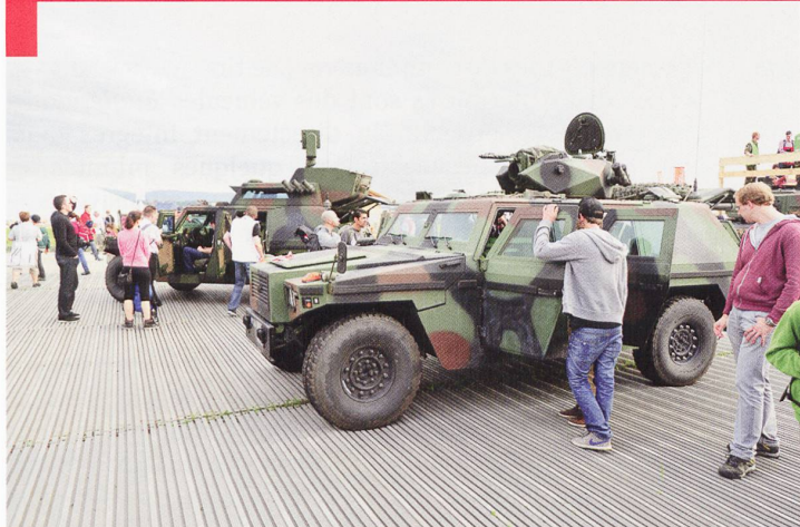
Le véhicule d'exploration 93/97 Eagle, ici au premier plan, a été décliné en version commandant de tir. Il emporte ainsi les systèmes d'observation et de conduite des feux nécessaires à un officier et son équipe.