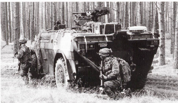
Les Néerlandais et les Allemands ont engagé des unités d'exploration équipées du Fennek .

L'exploration aérienne n'a pas été ignorée. Les formations d'exploration modernes sont appuyées par des drones tactiques.