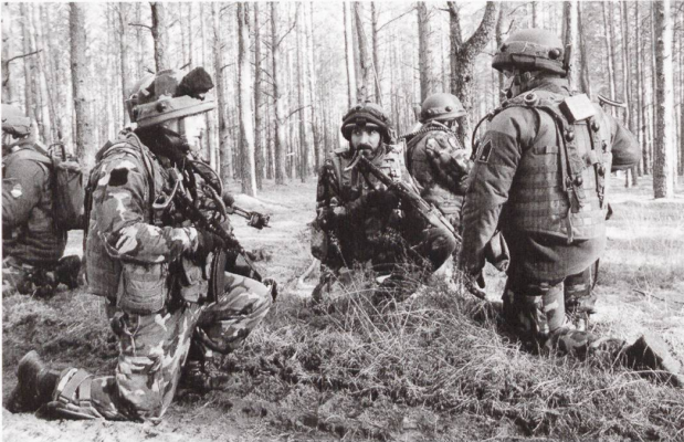
Ci-dessus : Des fantassins de la 5 e brigade hongroise « Bocskai Istvan. »