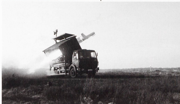
Ci-dessous: Lancement d'un drone tactique lors d'IRON SWORD 2014.