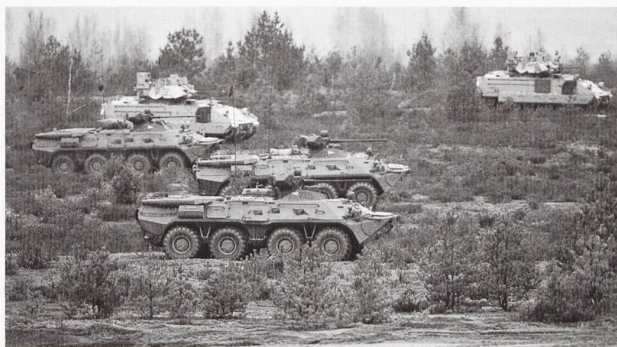
Image insolite présentant une patrouille « mixte » à tout point de vue, réunissant des BTR80 hongrois et des M3 américains.