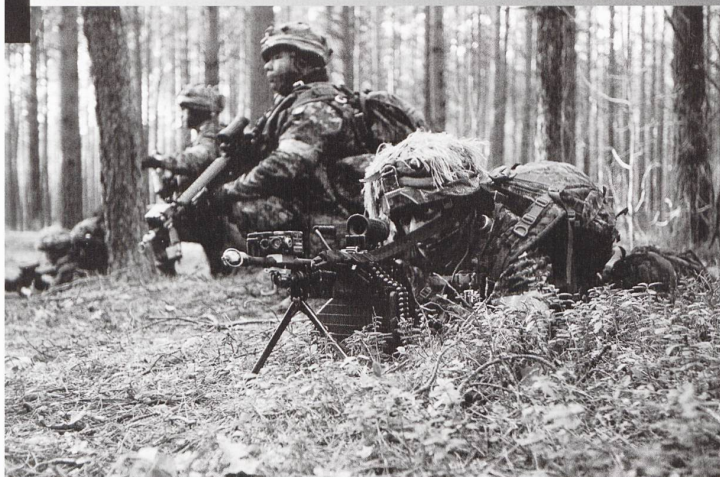
La Force ROUGE a été représentée par un contingent d'infanterie canadien.