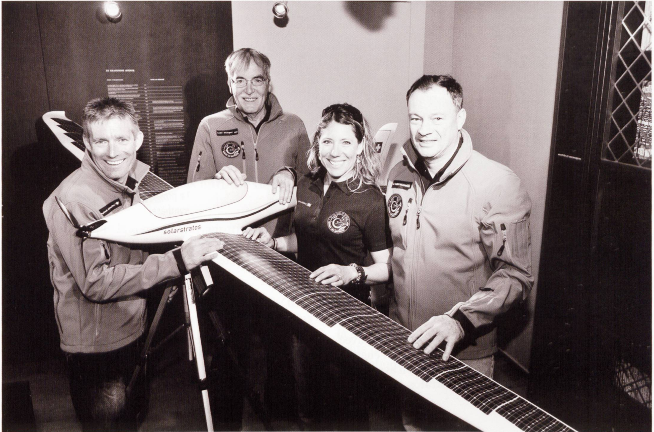
L'équipe aux commandes du projet SolarStratos.

pouvoir se libérer de la dépendance aux produits fossiles, d'une part disponibles uniquement en quantité limitée et, d'autre part, se libérer de la dépendance à la situation géopolitique mondiale qui évolue au gré de l'histoire. Le projet de Raphaël Domjan pourrait ainsi ouvrir là de nouvelles portes, notamment intéressantes pour l'équipement des futurs drones.