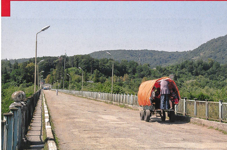
Le pont d'Inguri constitue le seul point de passage motorisé.