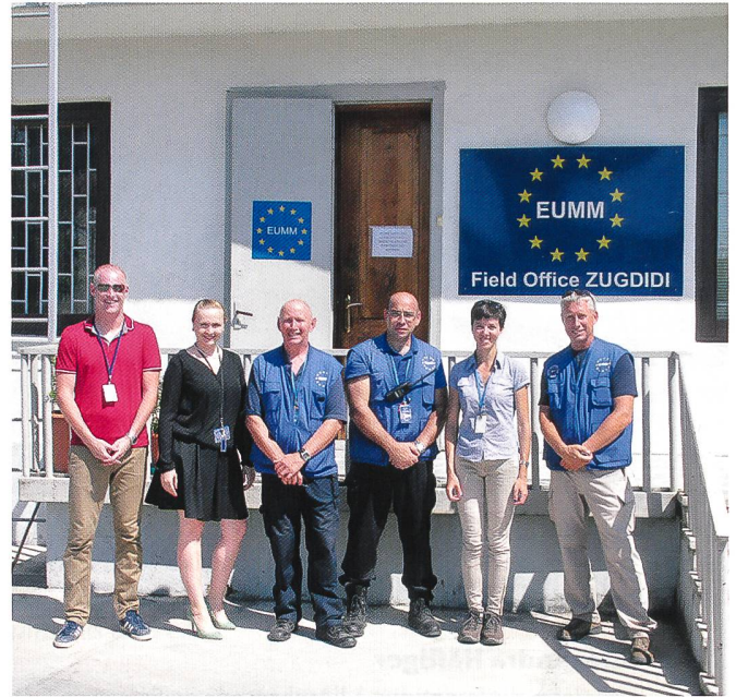
Notre patrouille devant l'EUMM Field Office à Zugdidi.