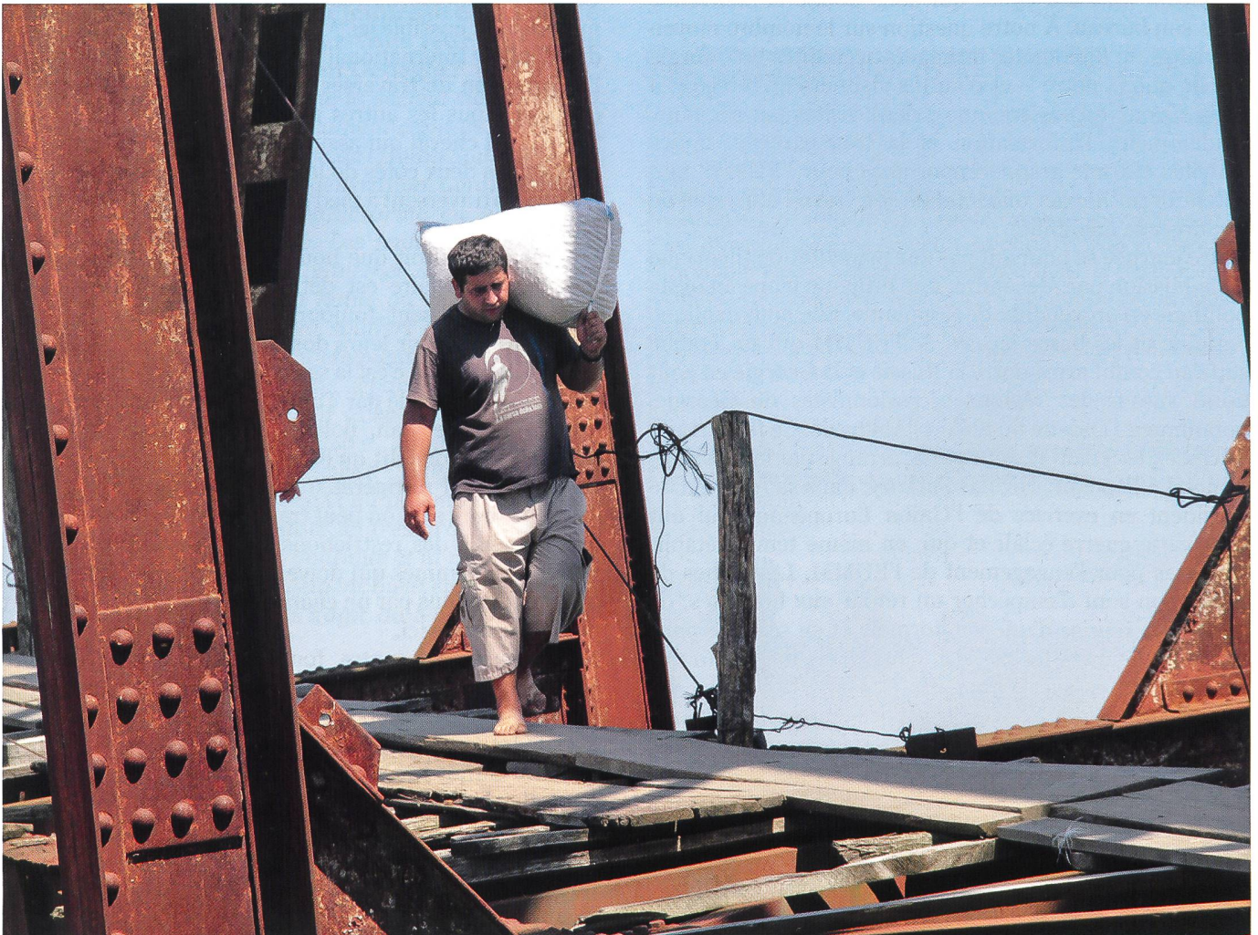
Un navetteur transporte un sac de noisettes.