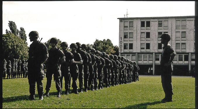
Ci-dessus : Préparatifs de la prise du drapeau du bataillon de carabiniers 14 à la caserne des Vernets. Ci-dessous : Déplacement en train spécial vers le secteur du cours de répétition : Walenstadt - St. Luzisteig.