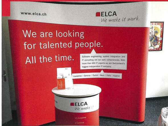
Le siège de l'entreprise, à l'avenue de la Harpe à Lausanne Photos © Auteur.