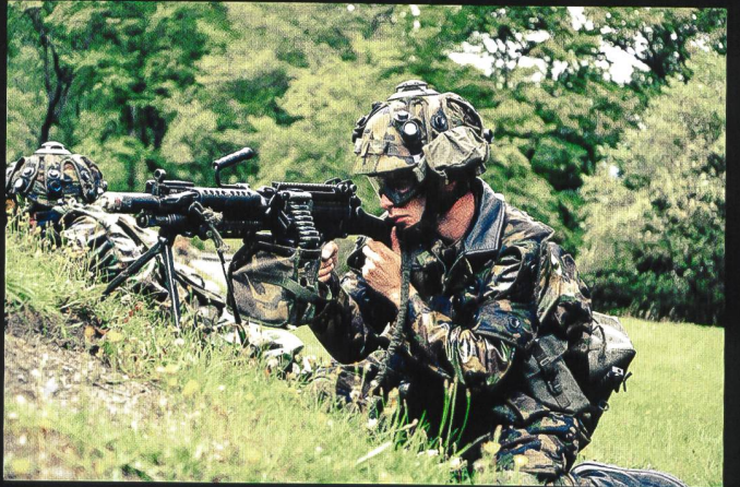
L'armement se compose d'un fusil-mitrailleur (FMDS) « Minimi », d'un Panzerfaust, d'un fusil à lunette.