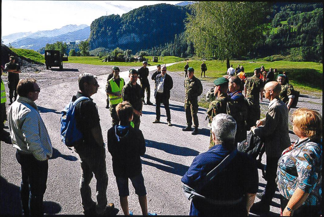
L'exercice HELIPOLI 14, qui présente le bataillon de carabiniers genevois à une délégation d'invités, en présence du brigadier Mathias Tüscher.