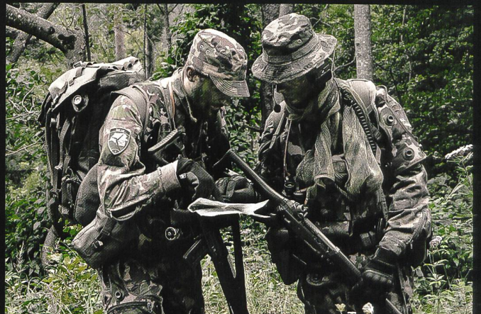
La compagnie d'état-major carabiniers 14 comprend une section d'exploration, équipée de 5 Eagles.