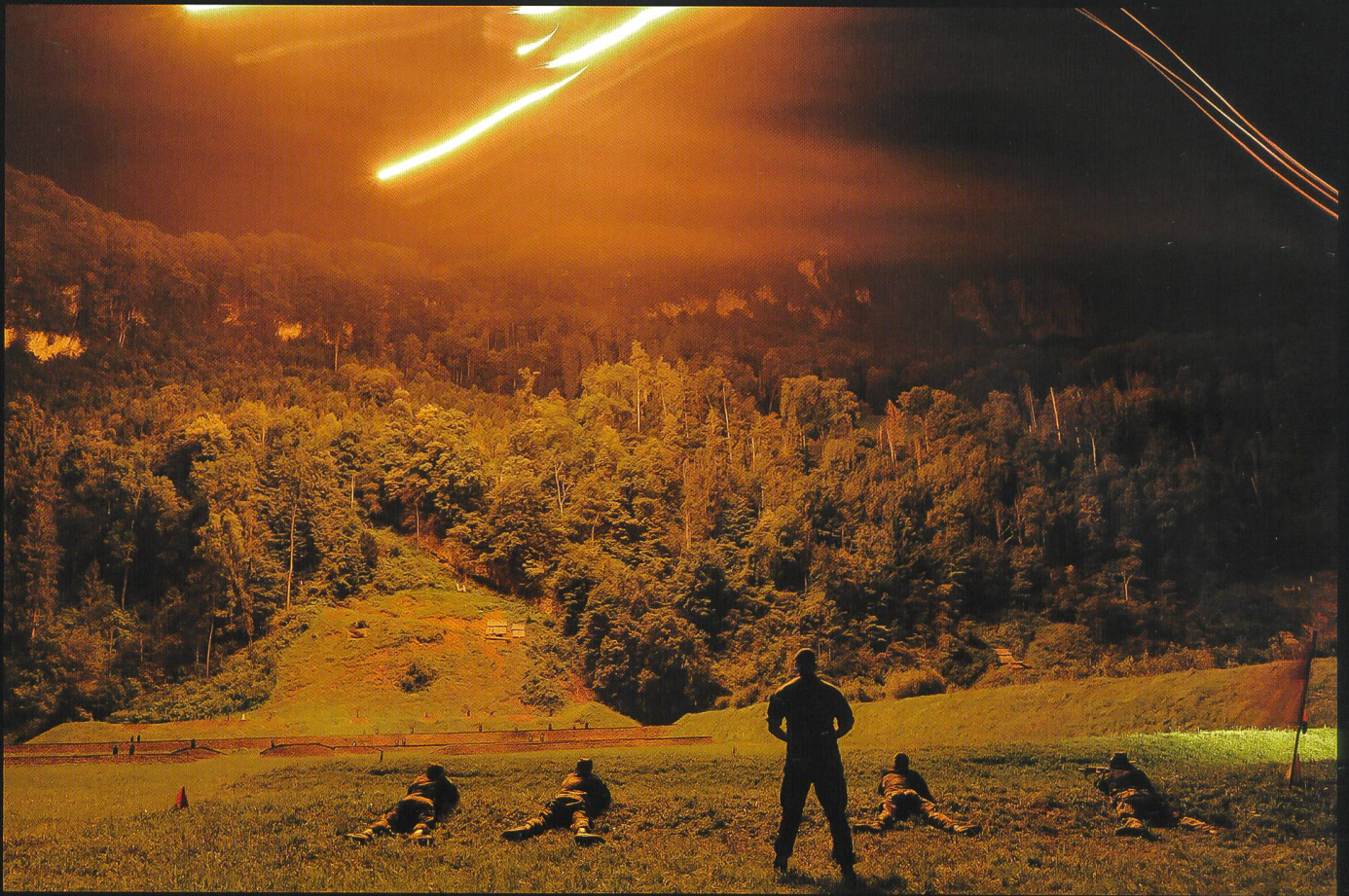
Exercice HEPHAÏSTOS – tirs de combat et de nuit, du bat car 14.