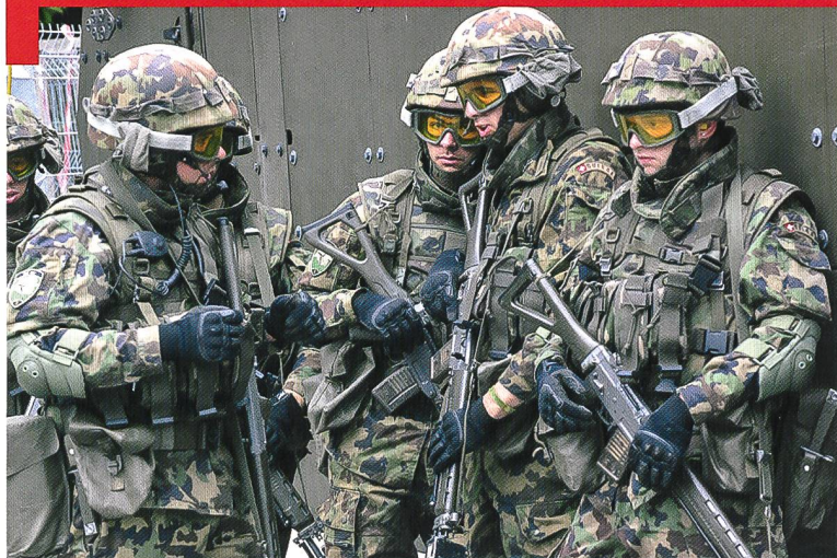
Préparation à l'engagement d'un groupe de fantassins, à l'abri derrière un GMTF. Bat car 1, Sion, 20.06.2015.