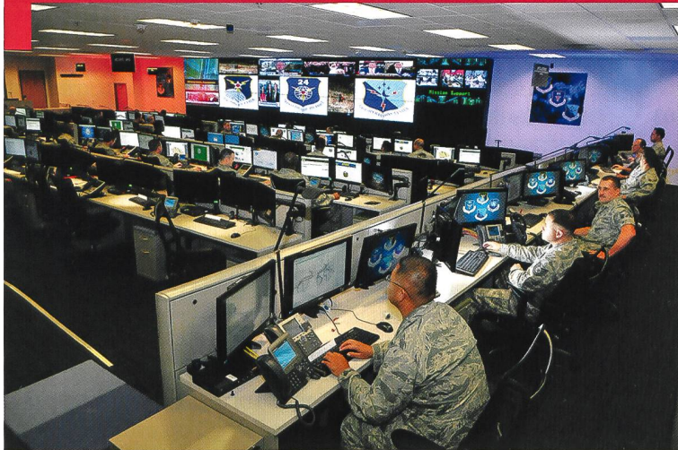
Au centre de la cyberguerre, les quartiers généraux du XXI e siècle.