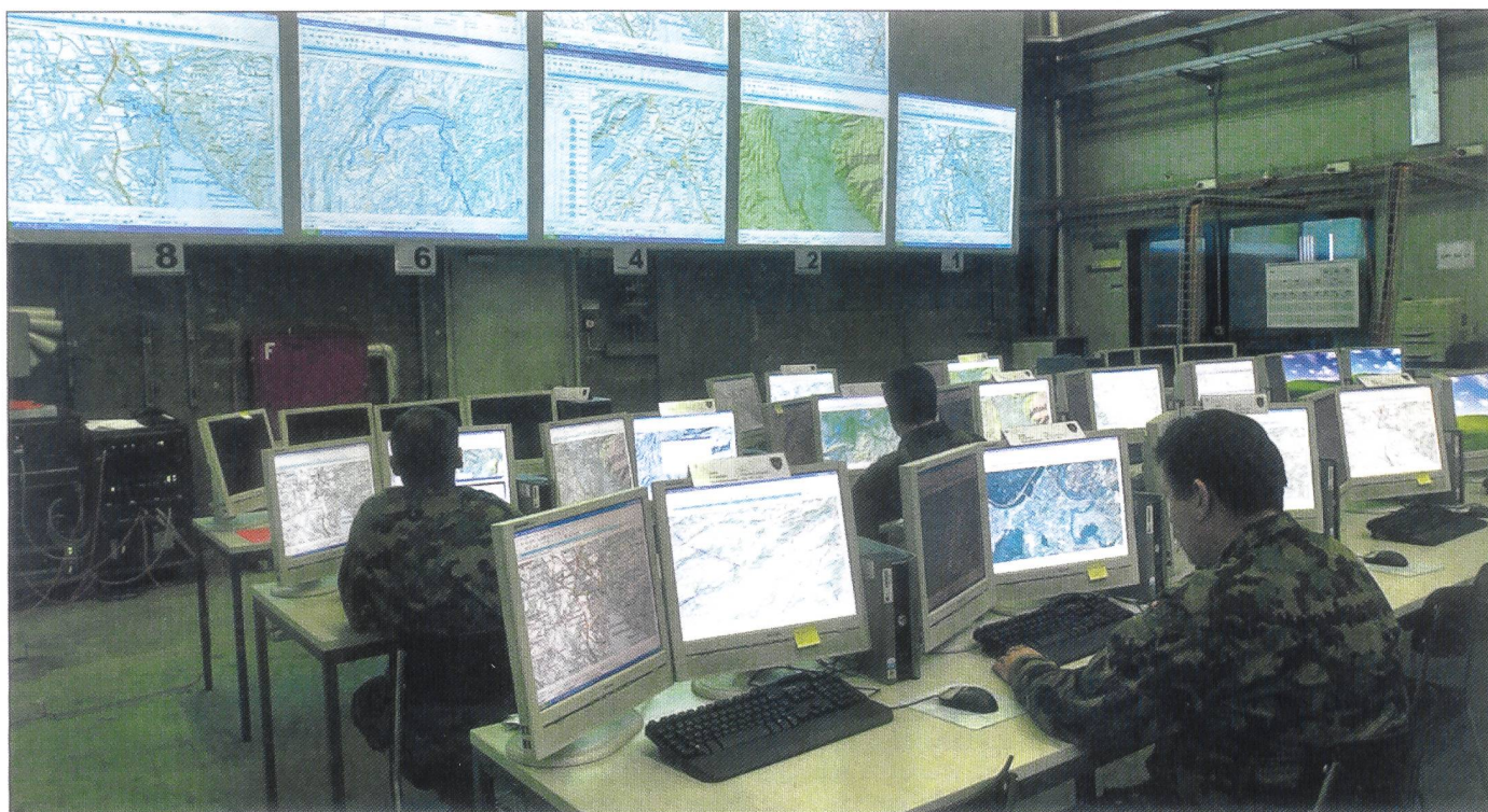
La Suisse n'est pas un hérisson cybernétique, ni le Pentagone à Berne... ni les quartiers généraux de l'Armée.