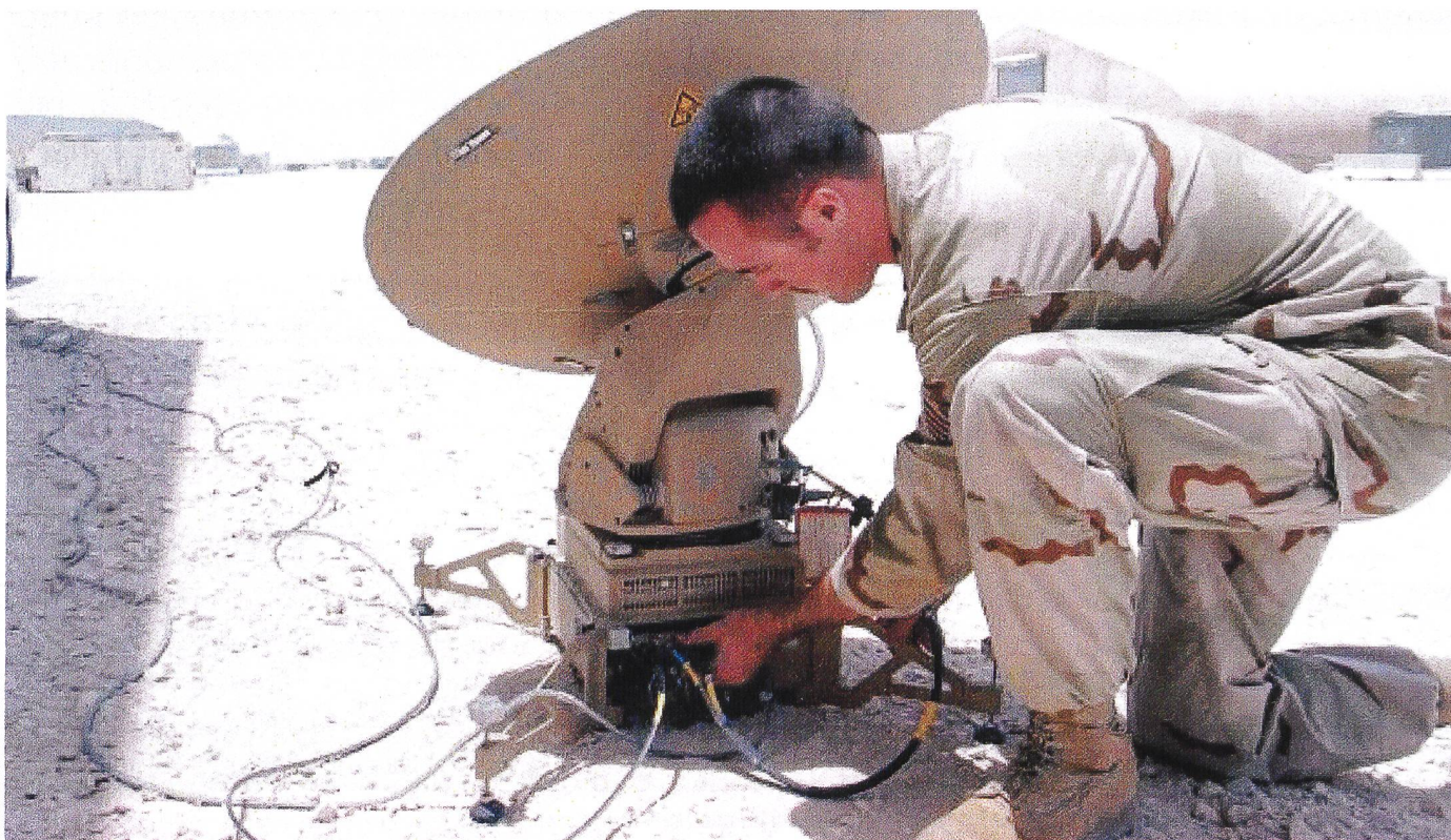
Des communications par satellites sont sensibles aux cyberattaques.

Au début 2014, l'Agence nationale française de sécurité des systèmes d'information définit les secteurs d'activités d'importance vitale, met au point une liste secrète de 218 opérateurs nationaux, publics et privés, à protéger en priorité, ainsi que les modalités pour en renforcer la cybersécurité. « Ce qui nous intéresse, c'est le command control d'une centrale nucléaire, les aiguillages de la SNF, les systèmes vitaux d'un hôpital. Tout ce qui, en cas de sabotage, d'une infrastructure entraînerait une catastrophe. 15 »