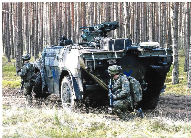
Ci-dessous : Un Fennek néerlandais, engagé dans un exercice combiné en Estonie (SABER JUNCTION), automne 2014.