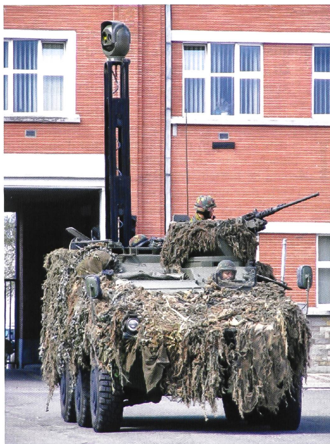
Ci-dessus : le Pandur 6x6 belge.