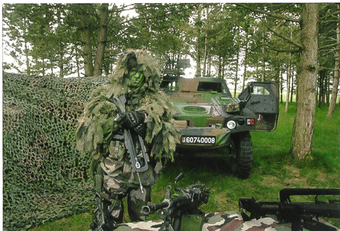
Matériel employé par le 2 e régiment de hussards (2 e RH) français.

Pandur dotés de nouveaux capteurs, et une compagnie d'exploration équipée de radars de surveillance montés sur Unimog et sur M-113. Acquis à l'origine comme transports de troupe, les Pandur ont été modifiés en véhicules d'exploration grâce au montage de nouveaux équipements électroniques, comme une boule optronique de type Margot 5000 , intégrant différents capteurs, dont une caméra thermique de nouvelle génération et une voie optique diurne facilitant l'observation à plus de 10 km de distance. Le bataillon dispose d'une capacité d'analyse du renseignement et peut disposer d'informations provenant de sources externes, comme le groupe des forces spéciales (SFG), les nacelles de reconnaissance des F-16 et les drones B- Hunter de la composante Air, les images recueillies par les hélicoptères Agusta A109, voire même d'images satellitaires, dans le cadre de l'accord que la Belgique a conclu avec la France pour utiliser les capacités du satellite Hélios 2 .