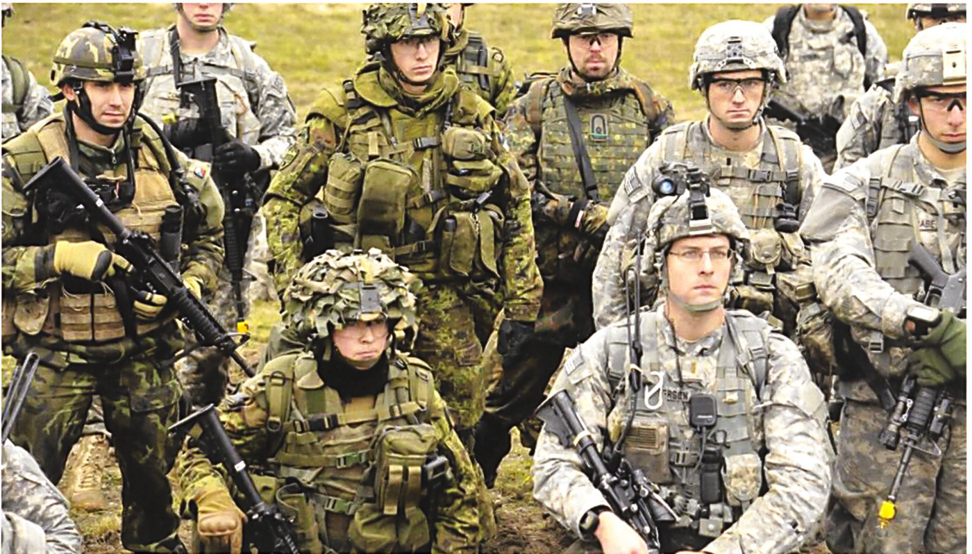
Soldats de l'OTAN participant à des manoeuvres dans les Pays Baltes.

La disparité des comportements et des performances est également collective, fonction de la proportion d'acteurs mais également des compétences liées de la formation. Même si le commandement fournit les mêmes ressources et les mêmes expériences aux différentes unités, il y en aura toujours qui seront nettement supérieures à d'autres.