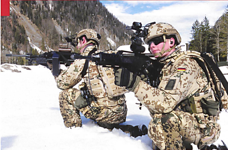
Soldats de la Bundeswehr équipés d'éléments du concept « Infanterist der Zukunft » (IDZ).