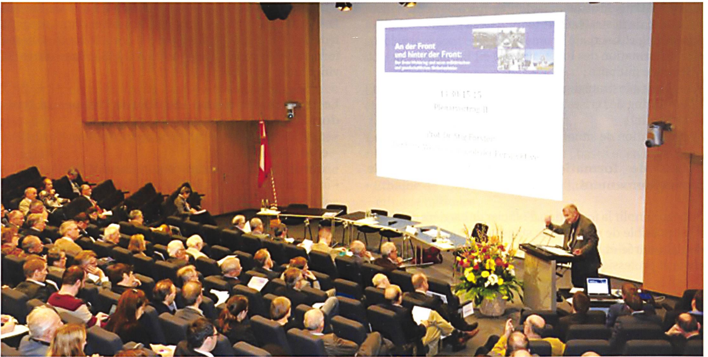
Une conférence organisée de concert entre la MILAK et l'École polytechnique de Zurich.

supérieurs et leur permet d'élargir leurs connaissances dans le domaine de la politique de sécurité, de la conduite opérative et des sciences militaires.