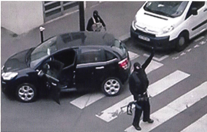
Les menaces terroristes et contre les infrastructures critiques exigent une réponse sécuritaire adaptée.

régulièrement déçus, c'est que l'une de ces trois fonctions a plus d'importance pour eux que les deux autres, et donc qu'ils ont davantage d'attentes dans ce domaine précis. Mais le système politique suisse est ainsi fait qu'un rapport sur la politique de sécurité découle forcément d'un accord au sein du Conseil fédéral sur le plus petit dénominateur commun, soit sur des propositions qui obtiennent un large consensus dans l'administration fédérale, y compris le Service de renseignement et l'Armée. Ainsi, dans notre pays, le ministre de la Défense ne peut pas utiliser le rapport sur la politique de sécurité pour faire connaître ses visions d'avenir. A titre de comparaison, en France, la commission chargée de rédiger le Livre blanc sur la défense et la sécurité nationale dispose d'une marge de manœuvre plus grande.