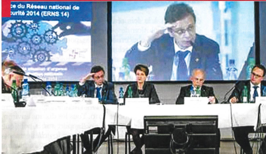
Les Conseillers fédéraux Ueli Maurer et Simonetta Sommaruga participent à une conférence de presse lors de l'Exercice du Réseau national de sécurité (ERNS 14). Photo © DDPS.