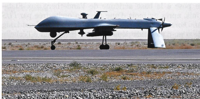
Ci-dessus : Predator américain.