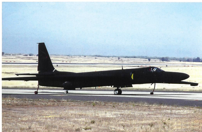
Avion américain de reconnaissance lointaine U-2.