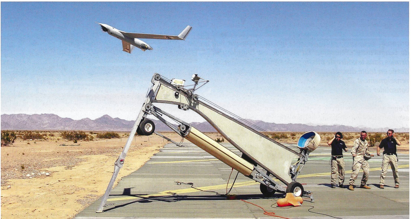
Scaneagle de Boeing sur sa rampe de lancement.