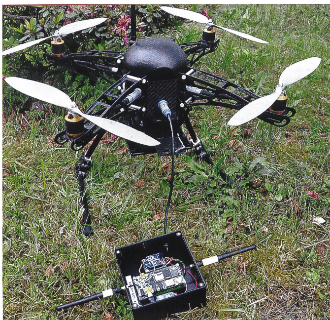
Mini-drone Fly-n-Sense .