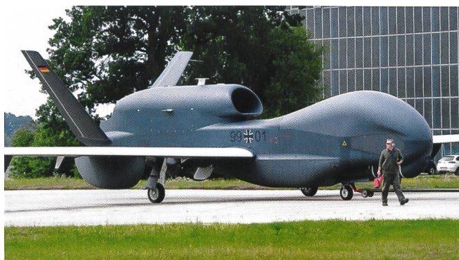
Drone MALE EuroHawk.