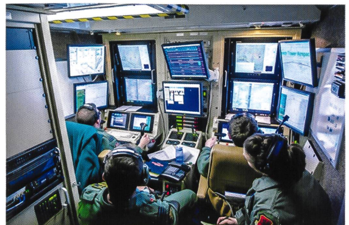
Station de contrôle d'un drone HALE ou MALE.

Si l'autonomie d'un mini-drone de moins de 5 kg ne peut dépasser 50 minutes, le Skyranger canadien est le seul capable d'effectuer des missions de reconnaissance à l'intérieur de bâtiments, il y évolue sans système de