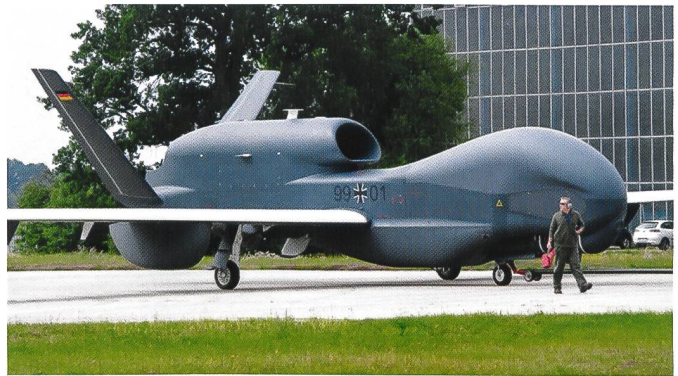
Drone MALE EuroHawk.