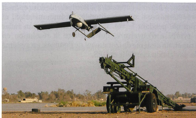
Ci-dessous : Shadow américain.

Est-ce à cause de problèmes d'éthique, de conditions de travail, d'avancement que l'US Air Force peine à recruter les pilotes et les opérateurs de MQ-1 Predator et de MQ-9 Reaper ? Il n'a pas été possible de mettre sur pied plus de 60 Combat Air Patrol (CAP), ce qui s'avère insuffisant au vu des besoins. 12