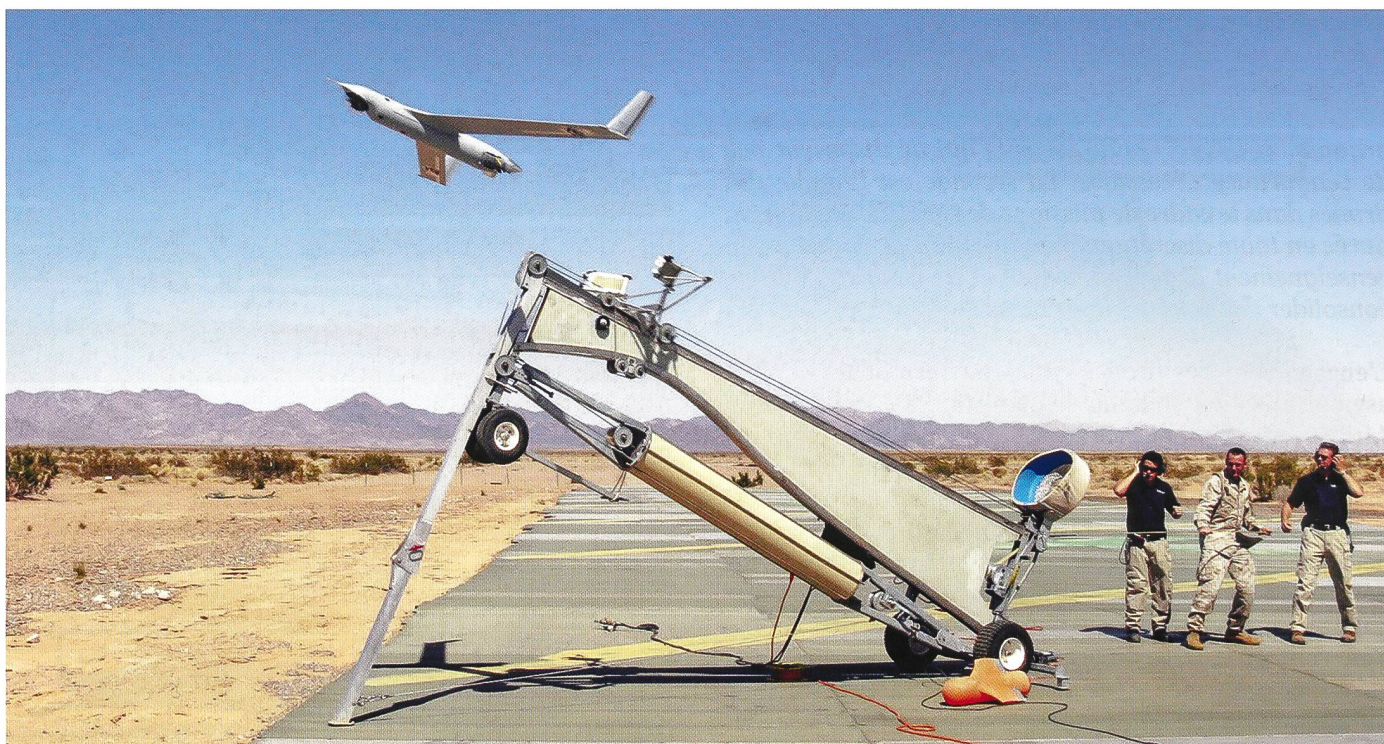
Scaneagle de Boeing sur sa rampe de lancement.