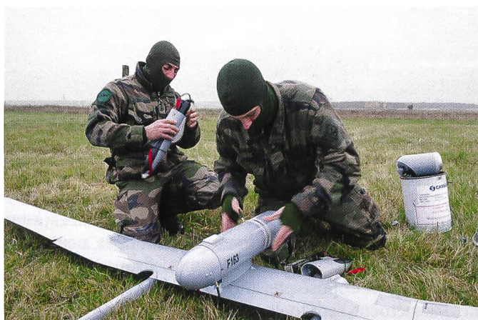
Mini-drone DRAC de l'Armée française.

localisation GPS grâce à une technologie qui lui permet de cartographier en 3D son environnement.