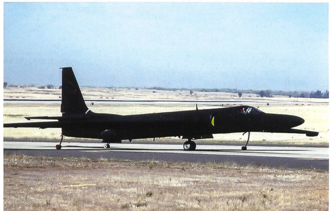
Avion américain de reconnaissance lointaine U-2.