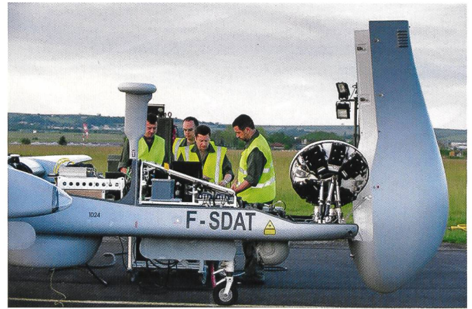
Harfang examiné sous toutes ses coutures.

Après une nuit d'infiltration dans l'Adrar des Ifoghas, pendant laquelle elle piste une cache d'explosifs d'Ansar Eddine, une équipe du 13 e RDP essuie des feux de lance-mines. L'observateur fait décoller un drone quadri-rotor de 2 kg qu'il emporte dans son sac. Il lui fait contourner la colline qui fait écran et localise en moins de deux