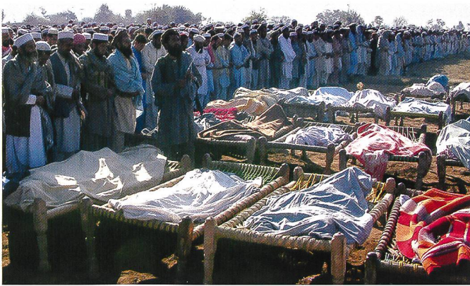
Les ONG montent au créneau des « bavures » et des « morts collatéraux » de la Guerre contre le terrorisme (GWOT) - ici au Pakistan.