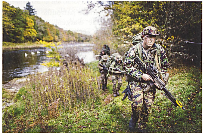
Ci-dessus : Rapport de coordination à la base opérationnelle avancée (Forward operating base – FOB), Cardiff – Pays de Galles.

Synchronisation des montres sur la zone de rassemblement (Assembly Area), Brecon Beacons – Pays de Galles.