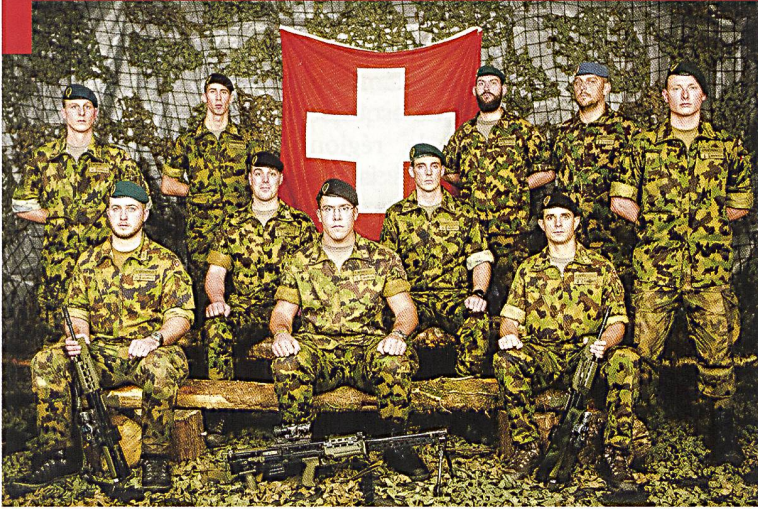
Le Team Swiss armed Forces lors de la cérémonie de remise des médailles, Sennybridge Barracks – Pays de Galles.