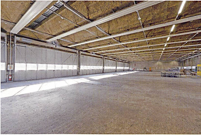
Ci-dessus: L'intérieur d'une halle de chars.

n'est pas idéal. La fraction UDC/PLR a ainsi posé la question au SEM dans une lettre ouverte: « Cela a-t-il un sens de placer des personnes qui fuient la guerre, dans une place d'armes où s'entraînent des militaires où se trouve du matériel sensible et de la munition à proximité immédiate, et où roulent constamment des chars? » Une autre question posée était la suivante: « Quelles sont les conséquences et les limitations imposées à l'exploitation et au déroulement des cours sur la place d'armes de Thounne? » Ou encore: « Est-il possible, dans ces conditions, de garantir une instruction de bonne qualité pour les recrues et les cadres? » En effet, on peut se demander si c'est à l'armée, encore une fois, de passer à la caisse et de s'adapter.