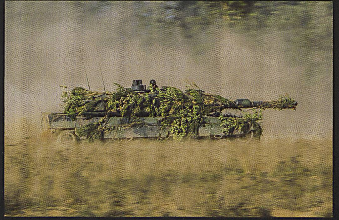
Ci-dessus : Le Mi 24 est encore en service dans plusieurs pays membres de l'OTAN. Ci-dessous et à droite : Les Léopards 2 polonais (A5) dans leurs oeuvres.