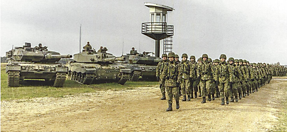
Défilé devant un alignement de chars Léopard 2 allemands et polonais, entourant un Challenger 2 britannique.