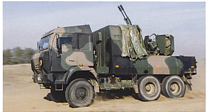
Un ZSU 23-2 monté sur un camion et un Dana de 152 mm de l'armée polonaise. Ils servent à l'appui direct des formations de combat.