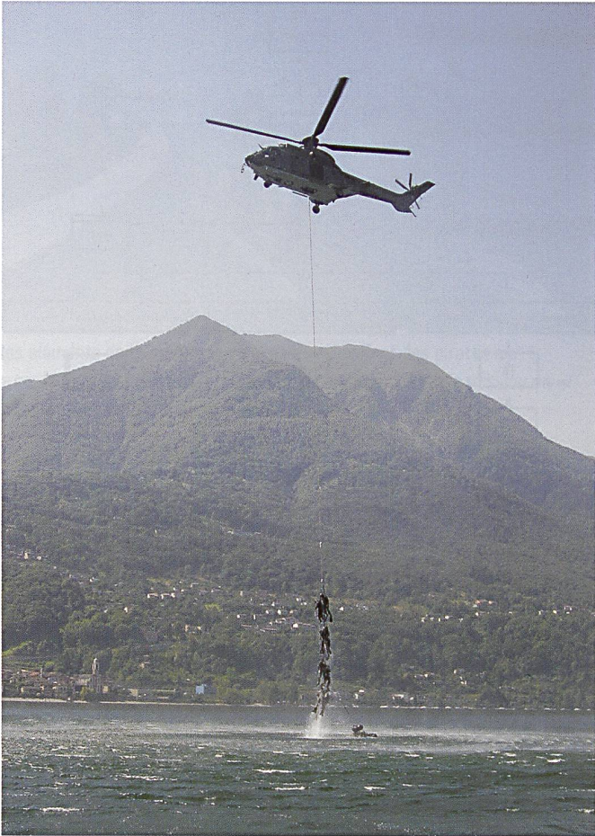
Ci dessus : Les opérateurs s'entraînent à la récupération dans un lac au Tessin par hélicoptère, selon la technique de la « grappe. »