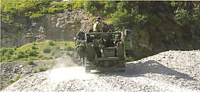
Ci-dessous : Progression d'un groupe du DRA dans un véhicule léger d'exploration O6.

avec détachement spécial de la police militaire. Dans le CFS, les deux unités doivent pouvoir être employées en commun, que cela soit à l'étranger que dans le pays.