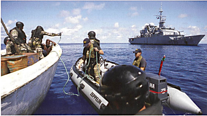
Des éléments de la marine française appréhendent des pirates au large de la Somalie. Le DRA 10 aurait pu participer à cette mission en collaboration avec la marine française.