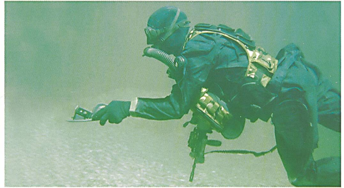
Un plongeur de combat du DRA 10. C'est avec ce type d'équipement que les opérateurs du DRA auraient pu récupérer les otages suisses.