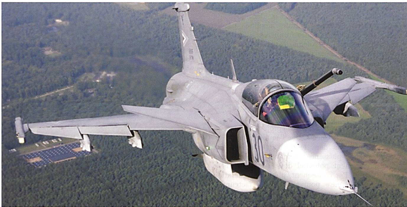
Le 14 avril 2016, les Forces aériennes hongroises ont fêté leurs dix ans sur le JAS39 Gripen suédois. Il est désormais question de former une escadrille mixte avec les Forces aériennes tchèques.

occidental (notamment en France) fait référence à la citoyenneté, tandis que l'Europe centrale a choisi la notion de « Kulturation. » En Europe centrale, depuis la fin du XVIII e siècle, les deux notions de la nation, civique et ethnique, s'entrecroisent. Ces notions sont caractéristiques des mouvements nationaux visant la création de l'Etat-nation dans un espace politique délimité par des frontières politiques. Dans le même temps, ces mouvements nationaux considéraient les communautés de langue identique, mais hors du territoire national, comme des composants de la nation. Dans la formation de la nation, le rôle joué par l'Etat, explique certaines différences dans la construction nationale entre l'Europe centrale et l'Europe occidentale. 6 « L'identité de la nation et du pouvoir d'Etat, chose naturelle en Europe occidentale, n'existait pas en Europe centrale; les nations vivant dans cette région manquaient de ce dont les nations de l'Europe occidentale disposaient de toute évidence: la réalité d'un cadre étatique, un appareil d'Etat, une culture politique homogène, une organisation économique constituée et rodée, une capitale, une élite intellectuelle, etc. 7 »