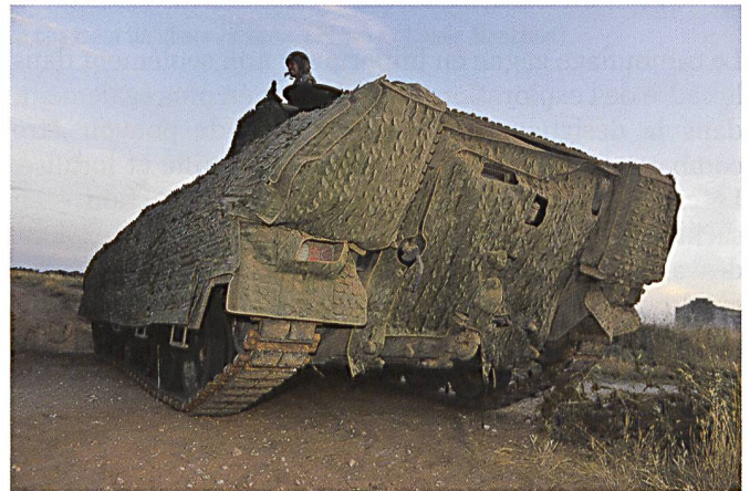
Image WBG nocturne d'un char de grenadiers équipé d'un kit de camouflage SSZ. Seuls n'apparaissent que le train de roulement et les phares. Le compartiment de combat semble avoir la même température que l'environnement.