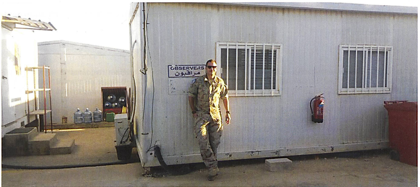
Ci-dessus : Dernière photo avant de quitter définitivement la « Patrol Base West , » devant la salle des opérations du Team Victor. Ci-dessous : Les intempéries rendent parfois la circulation difficile.