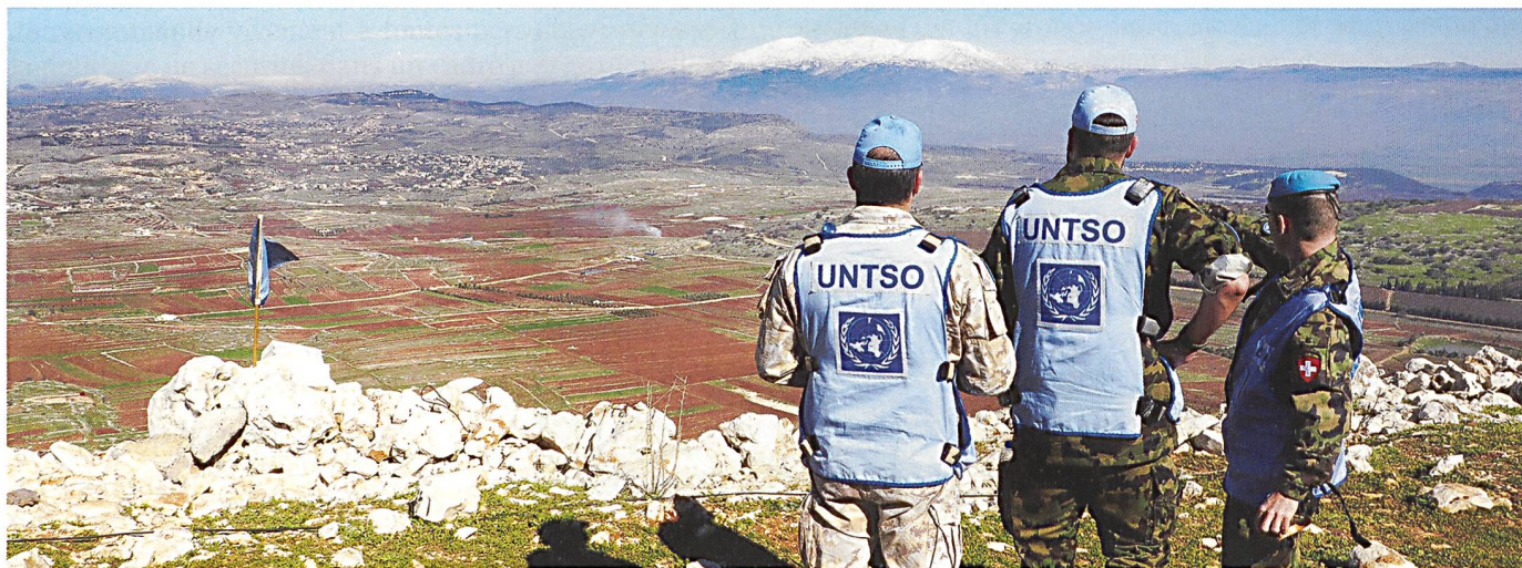
Vue sur les champs de tabac du Liban (g.) et Israël (d.), sous la bienveillance du Mont Hermon (au fond).

D'entrée, je vis un véritable choc. Je m'attendais à la destruction, aux munitions non explosées. Je m'attendais à un pays meurtri, appauvri, sans espoir. Si ces aspects-là sont bien réels (des séquelles des différentes guerres se voient sur les bâtiments jusqu'au centre de Beyrouth, et les champs sont tous minés), j'ai par contre rencontré un peuple souriant, positif, accueillant et généreux. Quelle belle leçon. L'Etat est inefficace. Les Libanais n'ont rien. Sauf une guerre chaque décennie. Et pourtant, ils vous ouvrent leurs portes, vous offrent le café. Chaque fois avec le même sourire et la même générosité. Même les ouvriers syriens dans les champs veulent partager leur maigre repas. Quelle belle leçon.