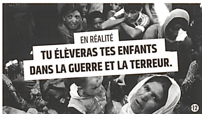
Image d'un clip produit par stop-djihadisme.gouv.fr. Celle-ci répond à la séquence suivante : « Ils te disent : Viens fonder une famille avec un de nos héros. »